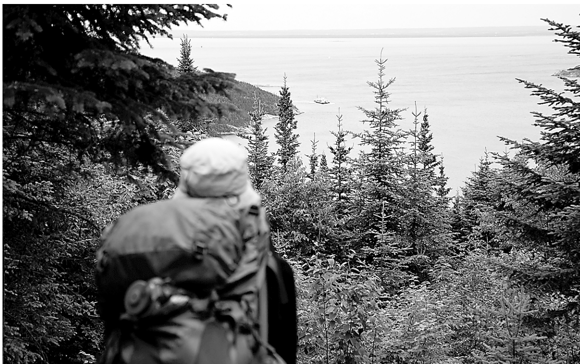
Pour faire le sentier en deux jours, on peut partir du stationnement de l'anse à Pierrot. Il faut alors compter un peu moins de 28 km pour arriver à Tadoussac, près de la station piscicole.

La deuxième journée est plus courte, débutant par une bonne montée dans la forêt qui réveille les mollets fourbus la veille. Quelques amanties tue-mouche flamboient sur le sol marron. En haut de l'anse à la Barque et de la pointe à la Croix, il faut suivre du regard les canots pneumatiques chargés de touristes venus chasser du regard les