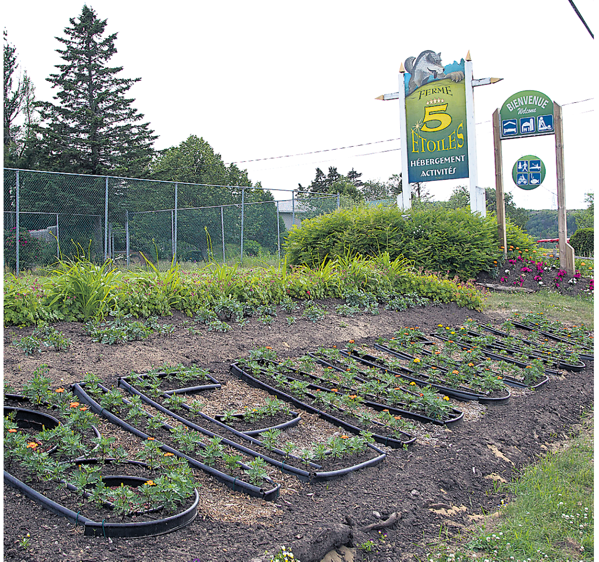
Sans être au cœur de Tadoussac, la Ferme 5 étoiles offre divers types d'hébergement à tarif raisonnable.