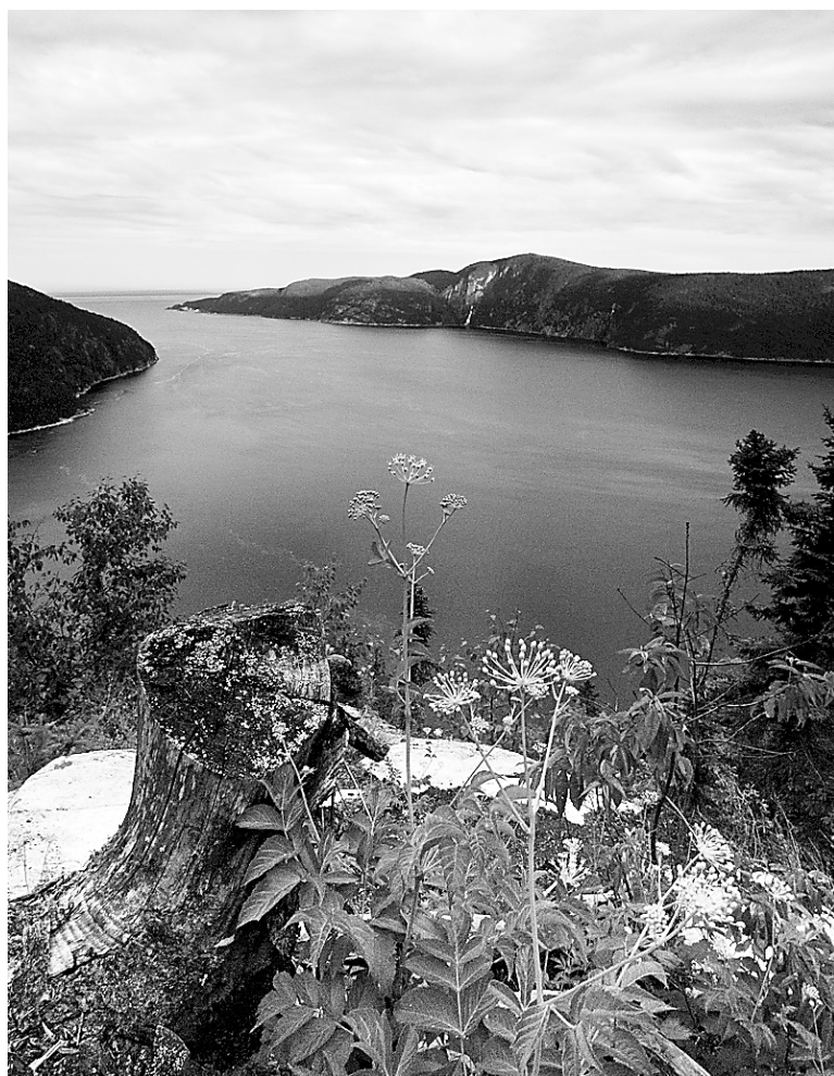
Le refuge du cap de la Boule surplombe le fjord : les couchers de soleil y sont tout simplement magnifiques.

Pour un circuit de deux jours vers Tadoussac, le départ est donné du stationnement de l'anse à Pierrot (d'autres points de départ, entre le