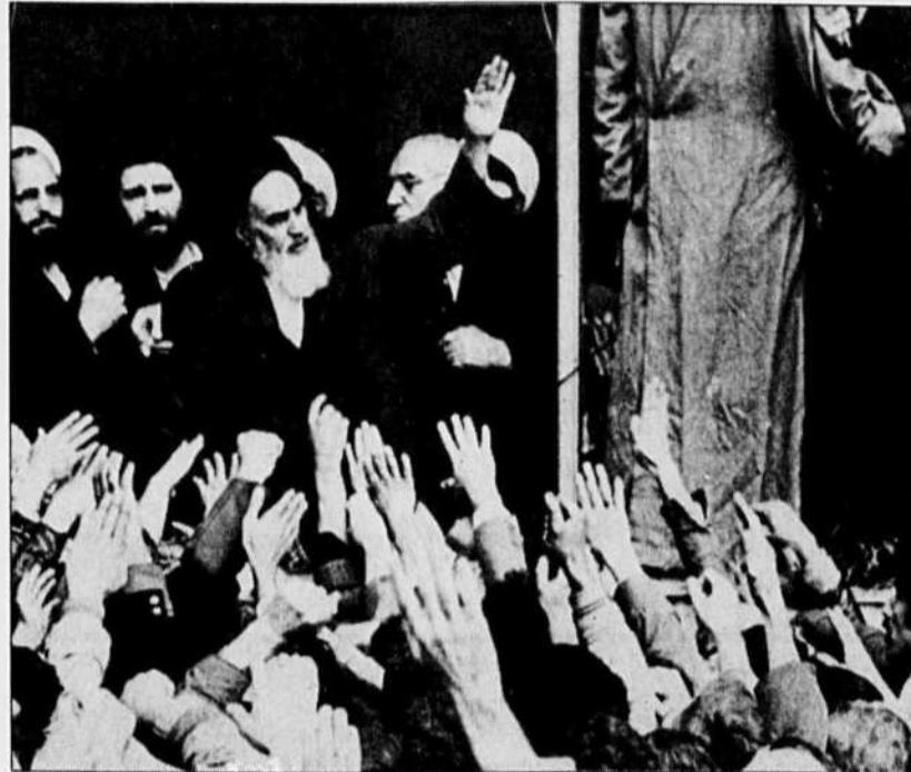
Février 1979 : le retour de l'ayatollah. Mais les lendemains ont déchanté.

guerre a radicalement transformé le paysage social de l'Iran au cours de la dernière décennie. Un changement profond s'est notamment produit dans la nature de l'assise sociale de l'État.