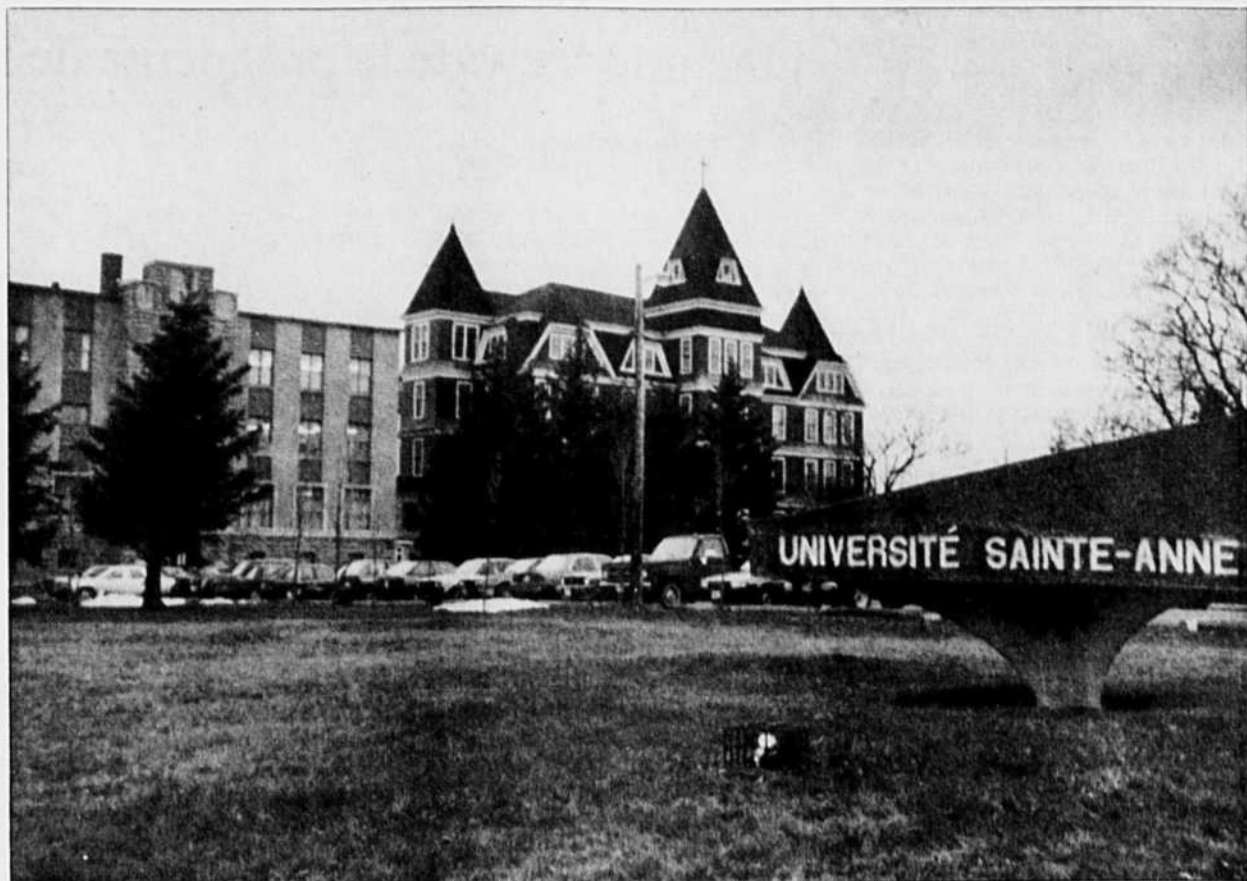
L'Université Sainte-Anne, seule institution postsecondaire de langue française de Nouvelle-Écosse.

Un bassin de recrutement assez faible et des ressources financières limitées. Les gouvernements assurent une certaine stabilité financière, mais qu'arrivera-t-il si le visage du Canada est complètement transformé ? En période de récession, peut-on compter sur l'argent des contribuables ? Le financement a toujours été une question impérative à l'université malgré la quasi-stabilité des dernières années et la santé actuelle de l'établissement. Pour son centenaire, l'université a