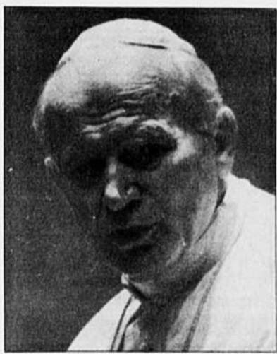
Jean-Paul II : autre chose qu'un pape réactionnaire.

Dans les pays de l'Est, il ne fallait pas davantage s'attendre à ce que