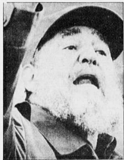
Fidel Castro : un des plus ignobles tyrans.

— Ce que vous dites des phénomènes de « restauration » dans le do-