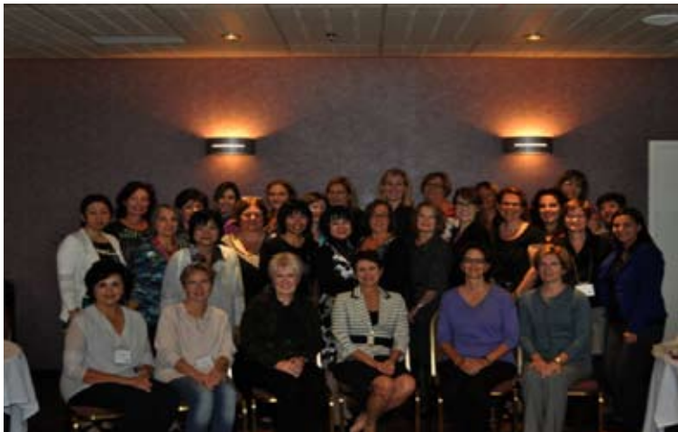
Participant·es à la réunion internationale

Grâce à la subvention obtenue des IRSC pour le projet intitulé « Partnering to Advance the Practice of Family Nursing in Health Care Services: An International Research Collaboration », l'équipe du CESIF a accueilli du 30 septembre au 2 octobre 2012, à Montréal, des chercheurs des États-Unis, Islande, Japon, Suède, et Thaïlande, afin de planifier avec les représentants de milieux cliniques (CHUM, CHU Sainte-Justine, Institut thoracique de Montréal-CUSM, Cité de la santé de Laval), un projet de recherche international sur l'échange des connaissances en intervention familiale systémique. Des travaux sont en cours pour soumettre une demande de subvention aux IRSC dans la prochaine année.