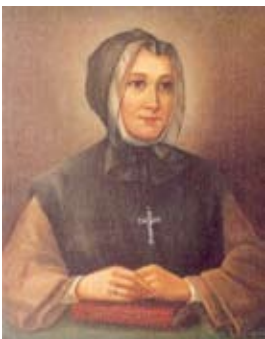
Marie Marguerite d'Youville (1701-1771)

La Congrégation des Sœurs de la Charité (Sœurs Grises) de Montréal lègue un cadre illustrant Marie Marguerite d'Youville. Le portrait de cette femme exceptionnelle, emportée par la passion de se donner aux autres et connectée à la Providence, sera en permanence dans la salle Alice-Girard. Merci pour cette présence qui a légué son cœur à l'histoire fabuleuse des débuts du Pavillon Marguerite-d'Youville.