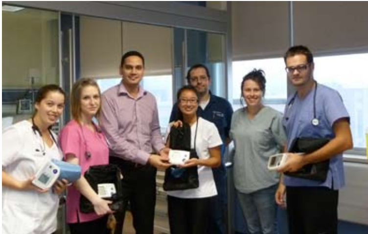
Remise des premiers tensiomètres