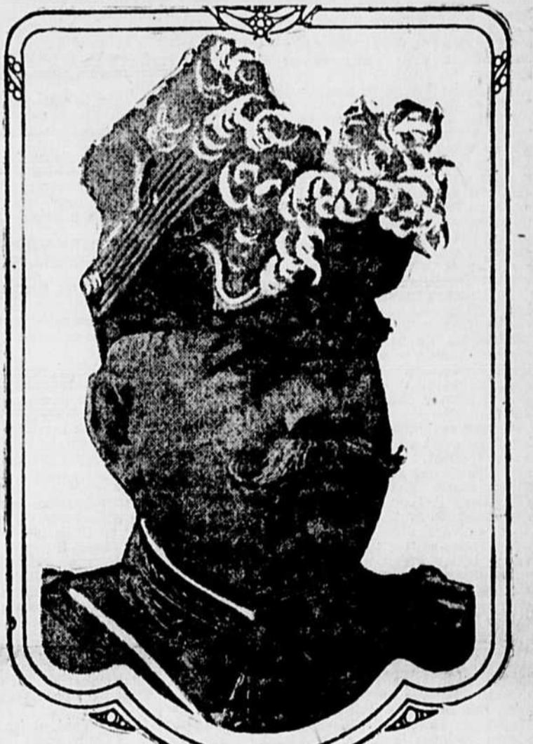
Le Gouvernement français vient de décider d'élever au maréchal l'illustre homme de guerre qui a fait l'admiration du monde.

Le maréchalat est le grade le plus élevé conféré à un officier général. Ce titre se rencontre dans les premiers temps de la monarchie. Il s'est appliqué d'abord à un officier supérieur placé sous les ordres du connétable ou du général en chef, et que l'on nommait maréchal de l'host ou de l'armée, maréchal de camp. Les maréchaux de camp de l'armée du roi étaient appelés maréchaux de France, pour les distinguer des maréchaux des autres seigneurs féodaux. Les maréchaux de France furent bientôt élevés au-dessus des autres maréchaux de camp, et acquirent une importance de plus en plus grande, surtout après la suppression de la dignité de connétable en 1626. Depuis cette époque, la dignité de maréchal de France est la plus élevée de l'armée. Le bâton de maréchal est la marque distinctive de cette dignité. Avant François Ier, les fonctions de maréchal étaient temporaires. Ce prince nomma le premier des maréchaux à vie, et en fixa le nombre à quatre. Ce nombre a beaucoup varié depuis; il y en eut jusqu'à vingt sous Louis XIV. Napoléon Ier changea ce titre pour celui de maréchal d'empire qui est analogue à maréchal de France. Dix-huit furent créés en 1804.