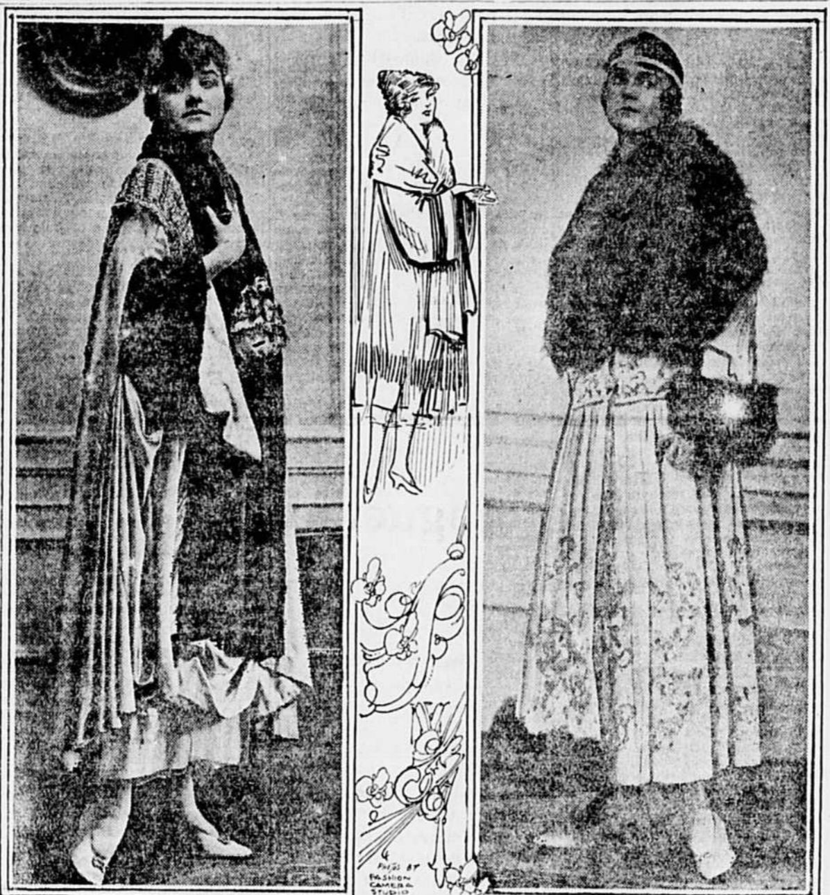
RICHES TOILETTES DE SOIRÉE.—Nous illustrons ci-dessus deux superbes toilettes de soirée. Une est en velours chiffon bleu, richement garnie de dentelle d'or. Larges poignets et collet en seal. L'autre est une splendide toilette en velours blanc richement brodée d'argent. Elle a comme trait distinctif un large collet en renard. Les poignets et la bordure du panneau sur le devant sont aussi en renard.

Voici les neutres qui s'ébranlent : la Confédération suisse, le roi d'Espagne, la Hollande, peut-être, demain, les Etats-Unis, demandent ou demanderont aux gouvernements impériaux des explications au sujet de la déportation en masse des Belges et des Français du Nord. C'est bien, mais, pourquoi pas au sujet des Polonais enrôlés de force, au sujet des Tchèques fusillés ou emprisonnés en masse, au sujet de la Serbie ravagée, des Arméniens et des Libanais anéantis ? On ne peut pas faire à la tyrannie sa part. La politique allemande a pour principe et pour doctrine la supériorité de la race germanique sur toutes les autres races, par conséquent la suppression ou la domestication des autres races au profit de la race germanique. Quelle nationalité "inférieure" (c'est-à-dire autre que la nationalité allemande) peut échapper à ce verdict ? Les ménagements d'un Bethmann sont grimaques de circonstances. En cas de succès, le fond de l'âme agressive et oppressive se dé-