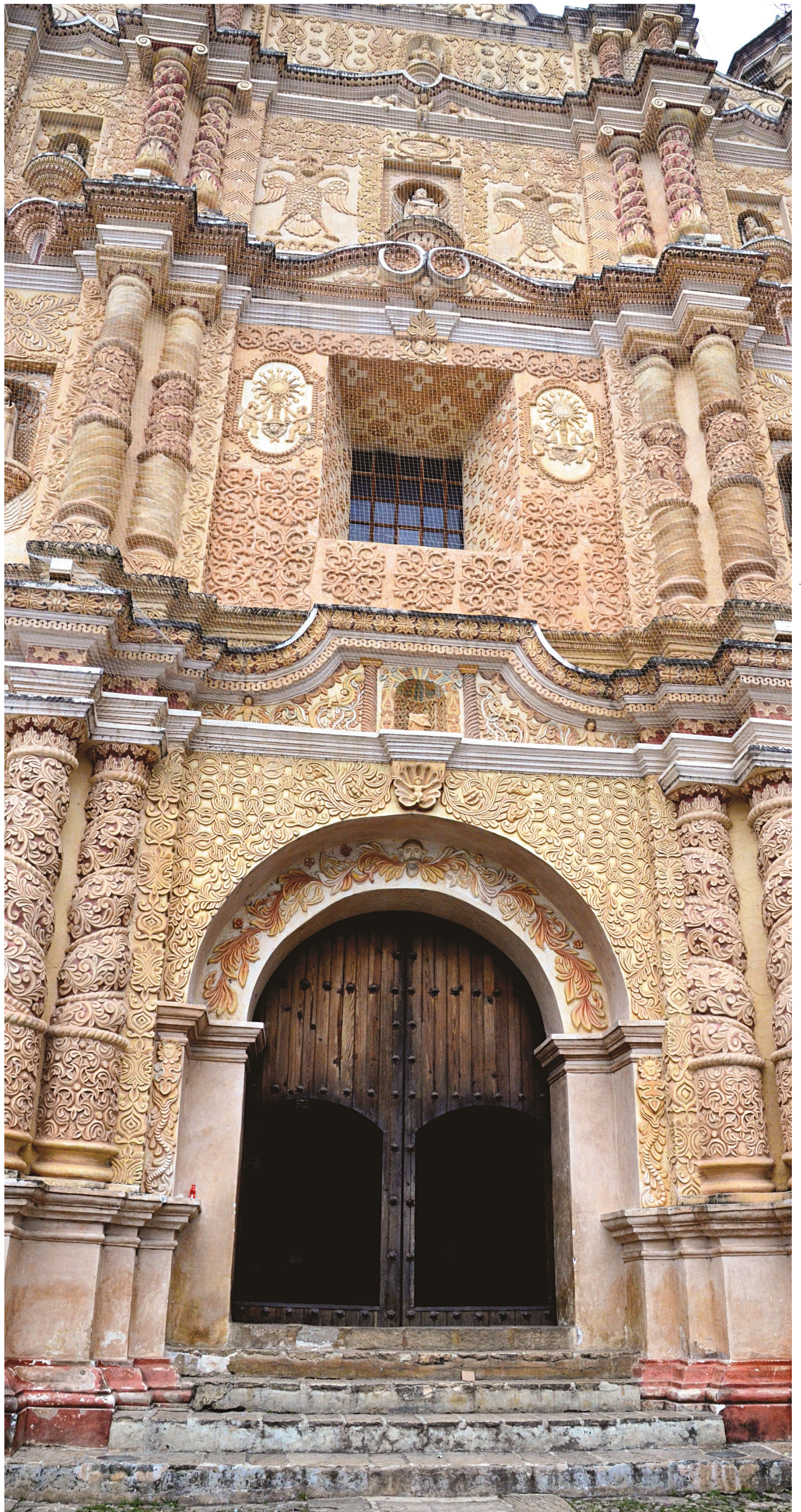
La façade de l'église de Santo Domingo, dans le village de San Cristobal de las Casas, a été sculptée dans le style baroque de l'époque coloniale.

Mais le calme est revenu dans cet État de plus de quatre millions d'habitants. Et le Chiapas est au nombre des États mexicains qui ne font l'objet d'aucune mise en garde du gouvernement canadien. Pas étonnant que les Chiapanèques, frappés à leur tour par la fièvre du tourisme, aient envie de présenter leurs joyaux. Et ils sont d'autant plus accueillants si le visiteur respecte certaines consignes, dont celle de ne pas prendre de photos sans le demander.