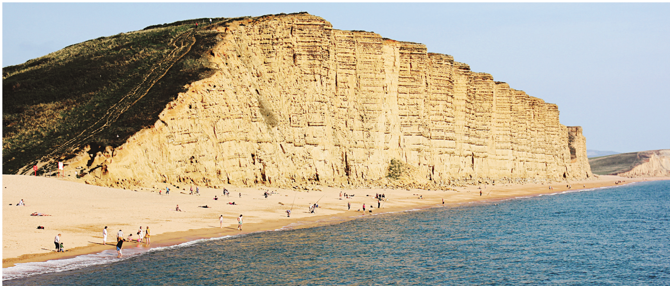
L'East Cliff, sur la côte jurassique à Bridport, alias Broadchurch, dans le comté de Dorset.

Tournés cet été et cet automne à Bridport, la ville qui se prend pour Broadchurch au petit écran, les épisodes de la deuxième saison, mettant en vedette la superstar anglaise David Tennant et une nouvelle venue dans l'intrigue, Charlotte Rampling, seront diffusés en 2015 chez les Britanniques.