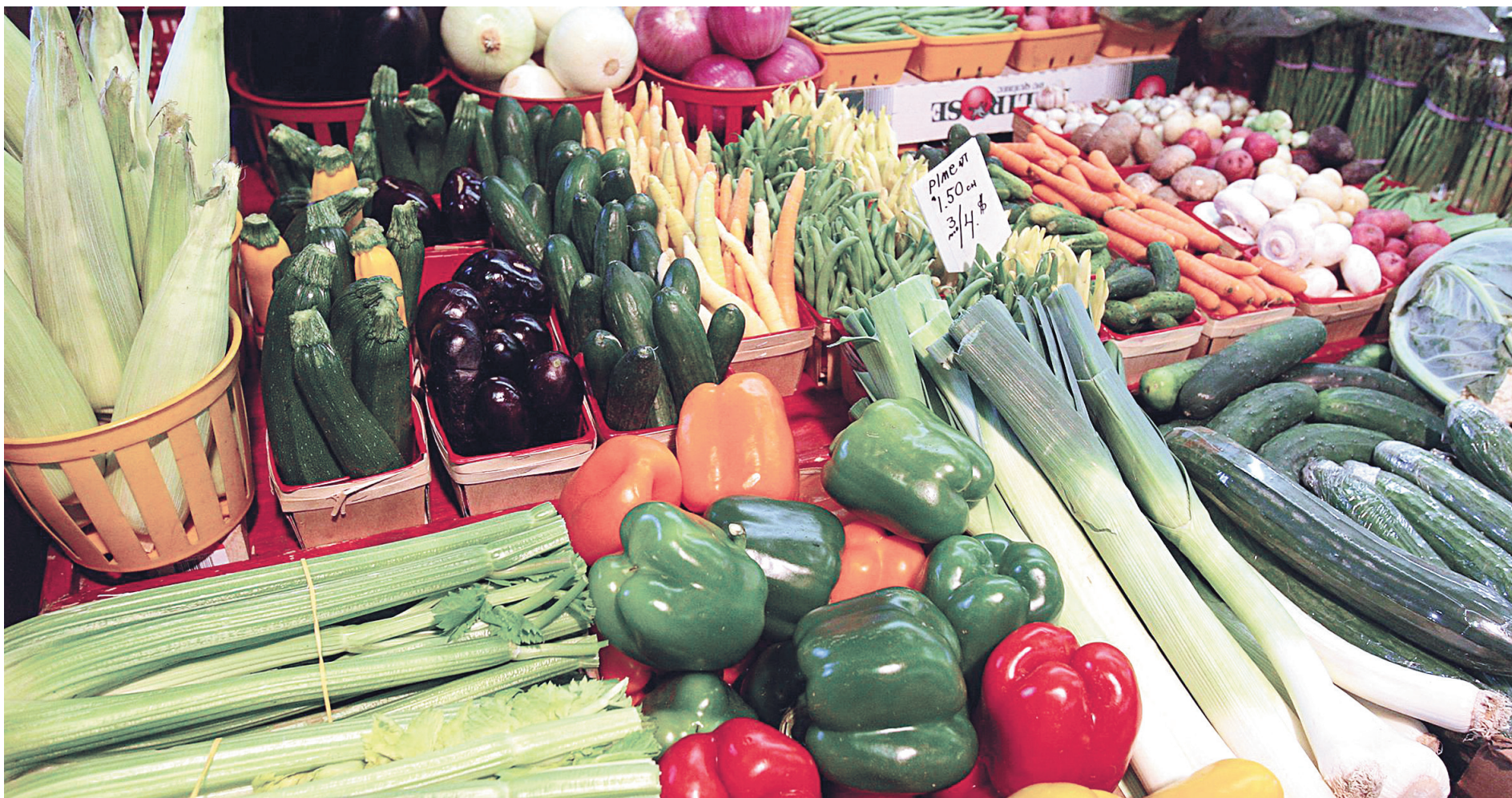
L'engouement pour les aliments biologiques et pour les fruits et légumes de qualité est de plus en plus grand au Québec.