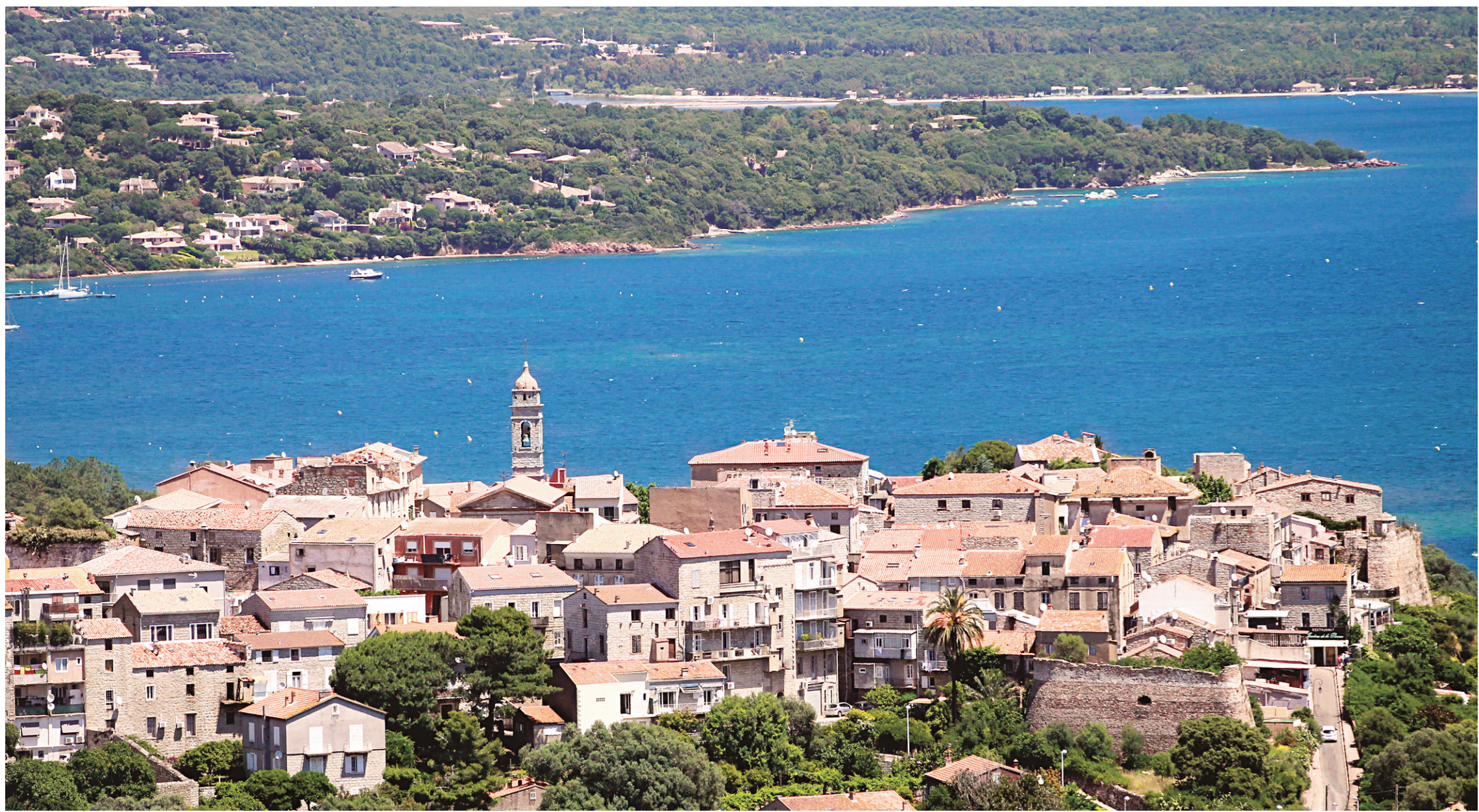
Une vue aérienne de la ville de Porto-Vecchio, en Corse.

En Corse, c'est dans les stations de montagne qu'on trouve les auberges les plus typiques. Alors qu'au bord de la mer, c'est la même chose que partout dans le monde. Les marchés villageois regorgent de vins de pays, de charcutailles et d'herbes du maquis.