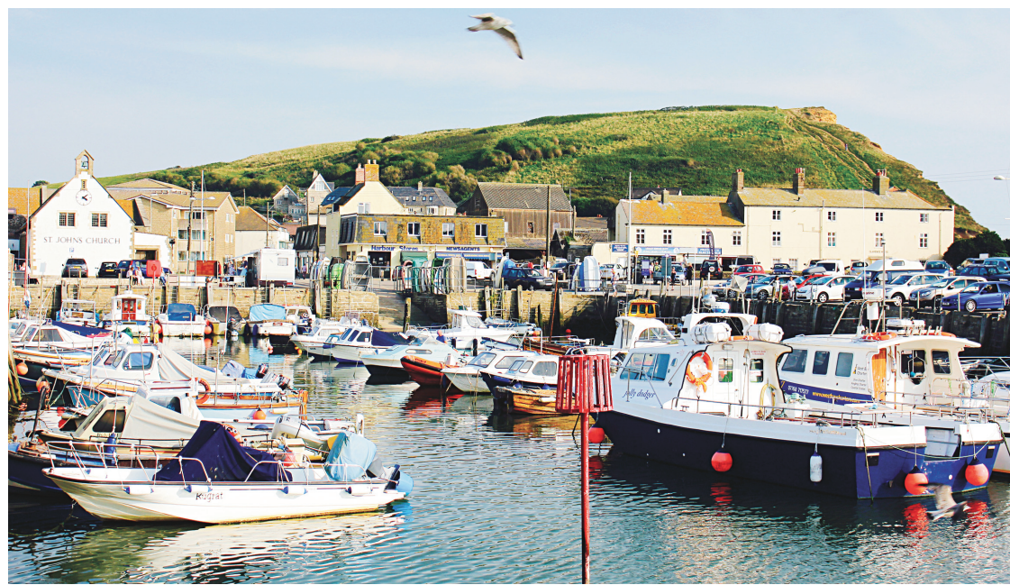
Le petit port de West Bay, à Broadchurch, oups!, à Bridport. En arrière-plan, la tabagie de Jack Marshall, un suspect au passé incriminant. (Quel triste épisode...). À droite: vous reconnaissez le poste de police de Broadchurch? C'est en fait un édifice résidentiel de West Bay, à Bridport, qui abrite notamment un restaurant — « Pas très bon », dixit notre guide — ayant servi de cadre aux scènes qui se déroulent au fameux poste.

Tournés cet été et cet automne à Bridport, la ville qui se prend pour Broadchurch au petit écran, les épisodes de la deuxième saison, mettant en vedette la superstar anglaise David Tennant et une nouvelle venue dans l'intrigue, Charlotte Rampling, seront diffusés en 2015 chez les