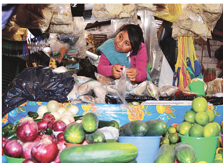
San Cristobal de las Casas et son Gran Mercado. Ci-dessous : la gastronomie est aussi généreuse que savoureuse dans le Chiapas.

Bien qu'on puisse visiter le parc naturel d'en haut par la route, le meilleur moyen de voir Sumidero est en bateau. L'expédition d'une trentaine de kilomètres dure deux heures. Notre lancha s'enfonça entre des parois rocheuses qui atteignent parfois 1000 mètres au-dessus