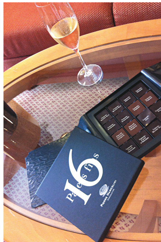
Collaboratrice Le Devoir