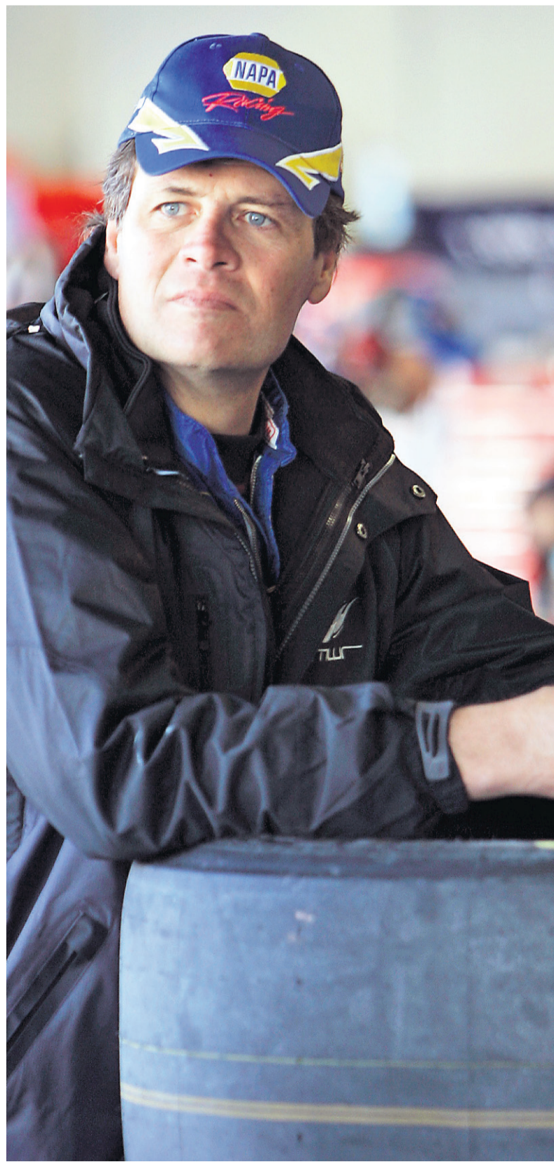
Michael Waltrip