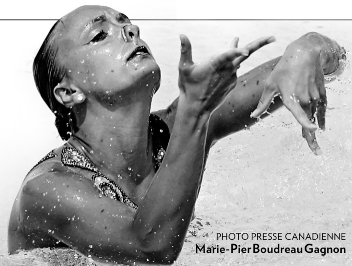
Marie-Pier Boudreau-Gagnon