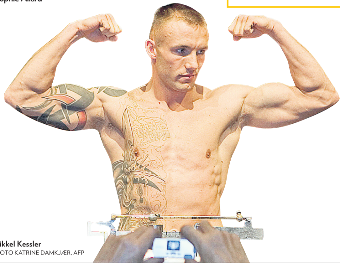
Mikkel Kessler

Mikkel Kessler : 38-0, 29 K.-O. Librado Andrade: 24-0, 18 K.-O. Demain, 21h45, HBO et TSN