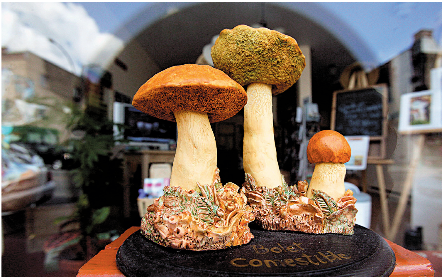
JACQUES GRENIER LE DEVOIR

Ce nouvel attrait pour les champignons est en grande partie dû à l'intérêt des restaurateurs pour les champignons goûteux. Ce qui était évident en Europe et en Asie ne l'était pas au Québec jusque dans les années 1990. Les champignons ont longtemps fait partie des peurs alimentaires d'ici alors le changement d'attitude est radical.