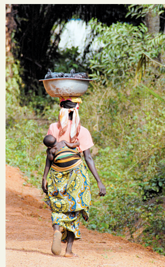
Femme avec enfant sur le dos

Ce reportage a été réalisé grâce à Air France, à Uniktour, à TIA et à Double Sens.