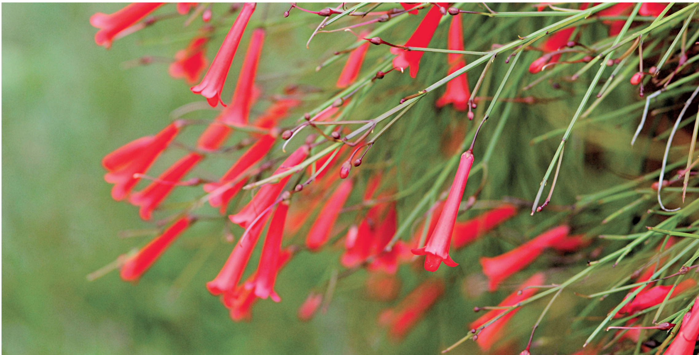
Le feuillage de Russelia equisetiformis est léger et fin.