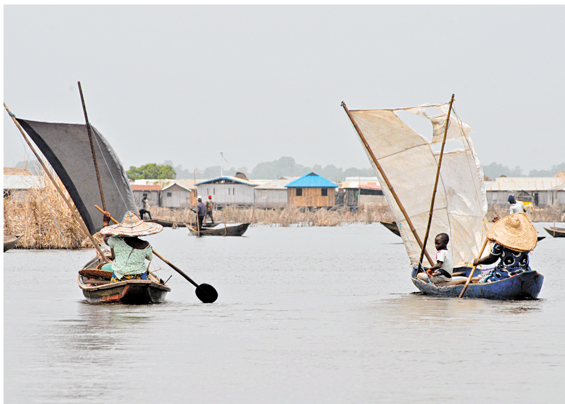
Bateaux dans la cité de Ganvié, l'un des lieux les plus inoubliables du Bénin.