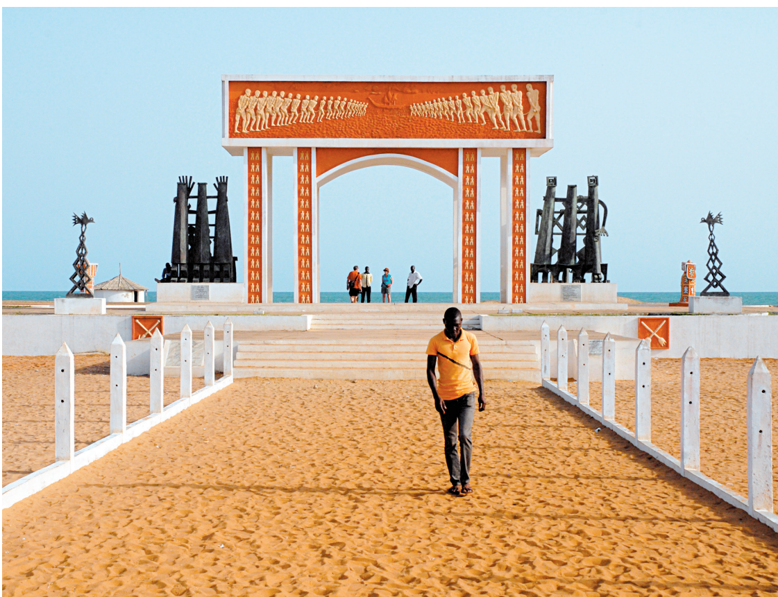
La Porte de non-retour, par où est arrivé le mal.

Berceau du vaudou, jadis siège de l'un des plus puissants royaumes d'Afrique et haut lieu de la traite négrière, le Bénin demeure étonnamment inconnu au bataillon des pays africains à voir en ce bas monde. Et pourtant, cette contrée francophone est l'une des plus fascinantes du continent noir sur le plan culturel. Compte rendu de pérégrinations sur la côte des Esclaves, et au-delà.