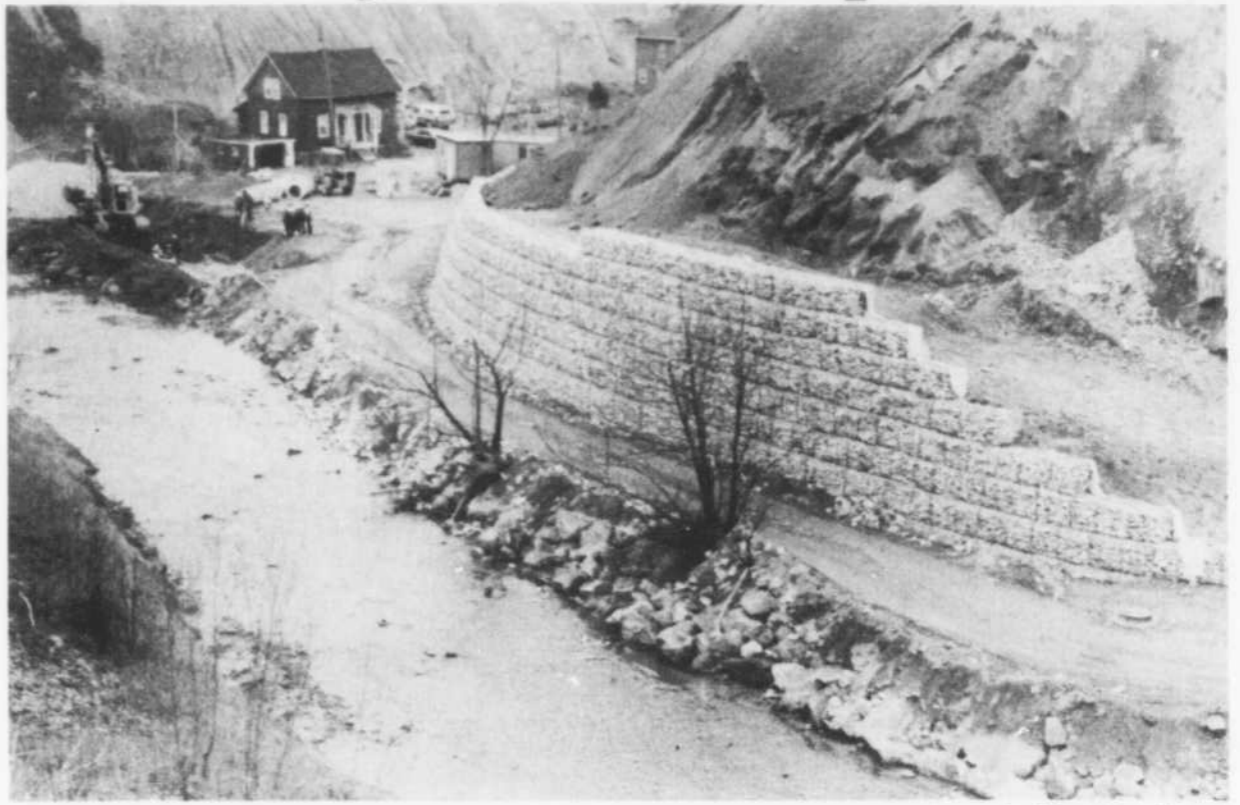
Dans le cadre des travaux d'assainissement de la rivière Bécancour, un mur de soutènement en pierres est actuellement érigé au pied d'une halde de résidus d'amiante de la mine Bell.

L'ensemble des travaux du projet auront nécessité des déboursés d'un peu moins de 30 millions $, subventionnés par le gouvernement du Québec dans une proportion variant entre 80 et 90 pour cent. L'échéancier accéléré est donc respecté et assure les cinq corporations municipales participantes d'une aide financière additionnelle.