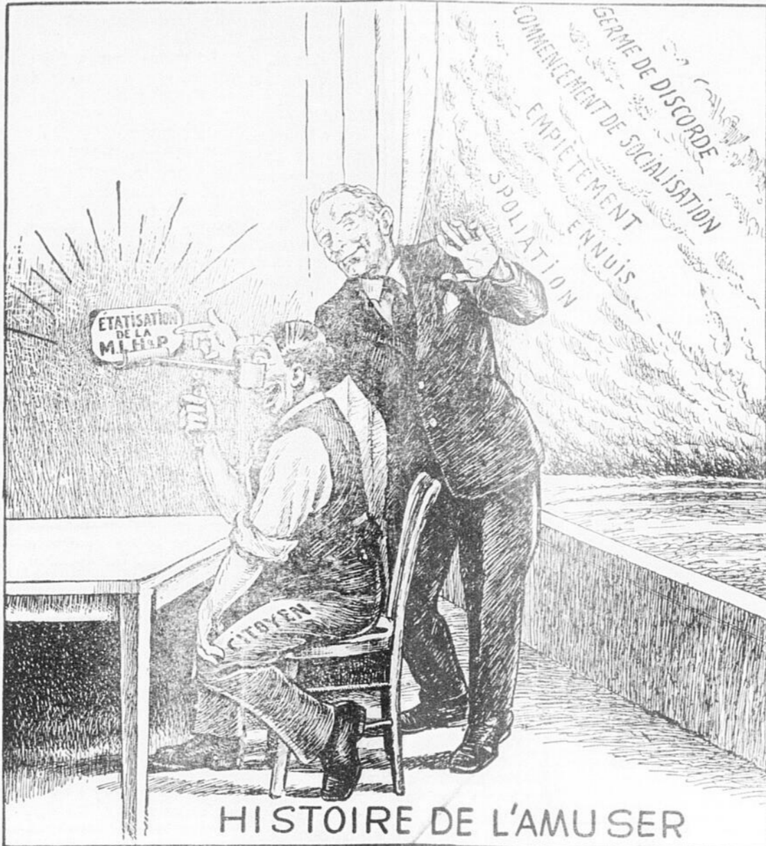
HISTOIRE DE L'AMUSER