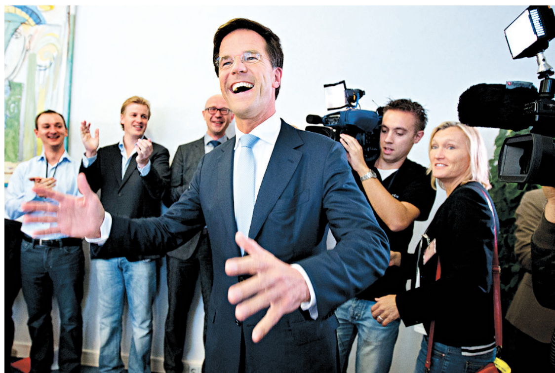
Le libéral Mark Rutte devra trouver un terrain d'entente avec les travaillistes.

Ses électeurs l'ont sanctionné pour avoir soutenu, puis lâché sans préavis, le gouvernement Rutte. Ils l'ont puni pour avoir délaissé ses thèmes fétiches de l'immigration et de l'islam. Ils ont aussi jugé totalement irréalistes, voire dangereuses, ses propositions de faire sortir le royaume de l'Union et de la monnaie unique.