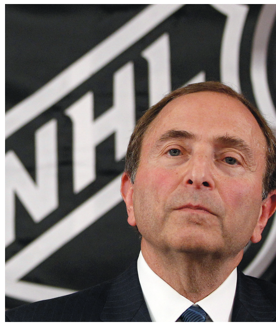
Gary Bettman: «Nous estimons que, comme ligue, nous payons beaucoup trop.»

Il a réitéré que la saison ne s'ébranlera pas, tant qu'il n'y aura pas de nouveau contrat de travail en place.