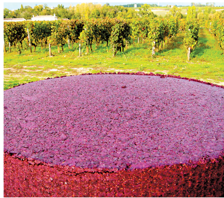
JEAN AUBRY LE DEVOIR

Où sont passés ces Certan de May 1976, Belair-Marquis d'Aligre 1978, Meyney 1979, La Conseillante 1981 et autres