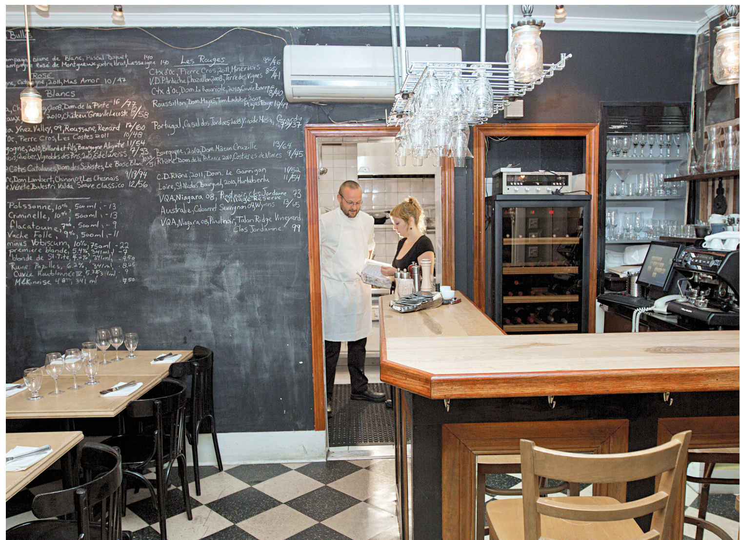
Mieux vaut réserver au Renard artisan bistro pour être certain de pouvoir profiter de l'une de la trentaine de places. Le mur, grand tableau noir, renseigne sur les plats et sur les vins.