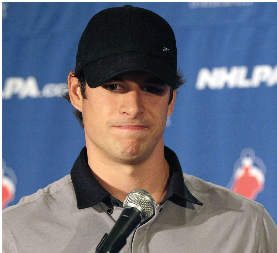
Sydney Crosby: «Dans mon cas, après avoir été inactif pendant presque un an et demi, je veux évidemment jouer, a-t-il déclaré. Mais vous devez aussi réaliser qu'il y a des principes et vous devez comprendre ce qui est bon. J'estime que ce que nous proposons s'inscrit dans la bonne voie. Si vous analysez les deux propositions, oui elles sont fort différentes. Les observateurs qui ne sont pas biaisés, et qui ne s'en tiennent qu'aux faits, constateront que notre approche ainsi que les éléments de solution que nous préconisons paraissent un peu plus équitables.»