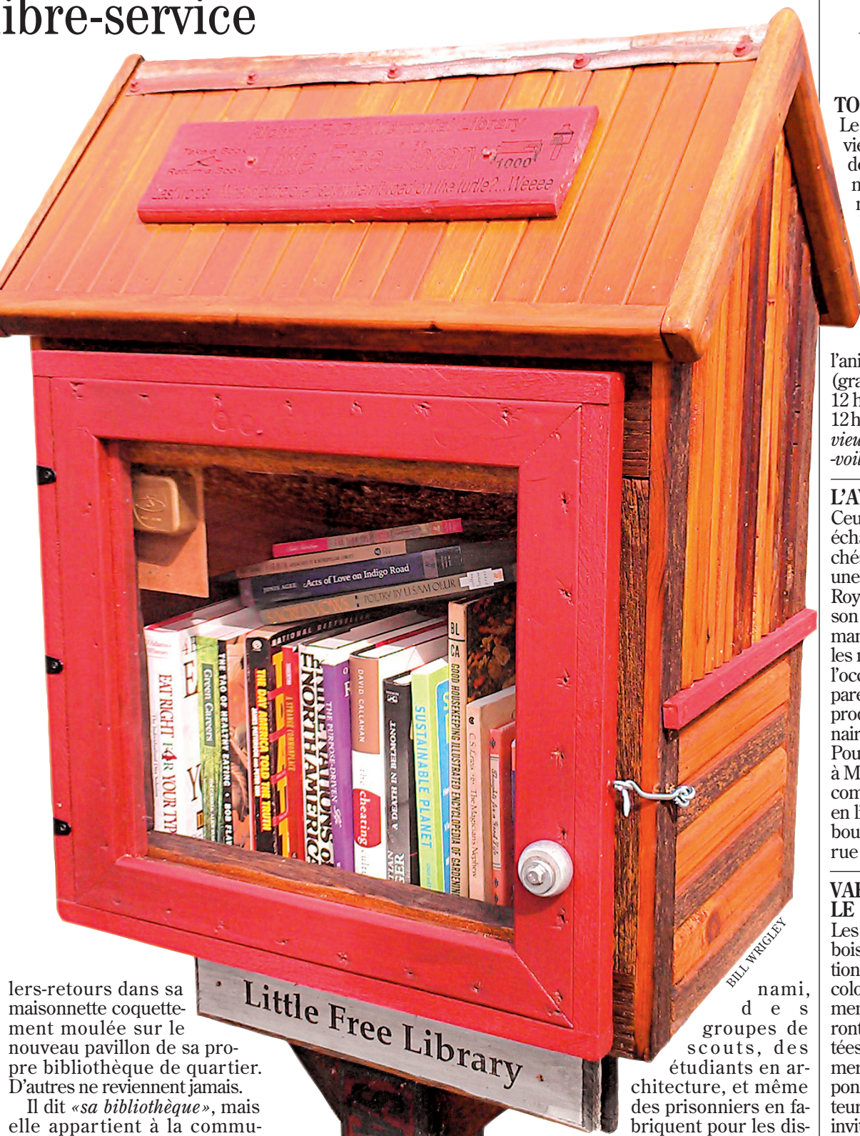
Little Free Library

Chaque libraire mitonne sa thématique, pour ce natif de Côte-des-Neiges, à Montréal, ce sont les «good reads», des essais, des romans «qui te rivent à ton fauteuil», précise l'octogénaire dont l'intonation ressemble à celle d'un amoureux trentenaire. The Girl With the Dragon Tattoo , de Stieg Larsson, a fait douze al-