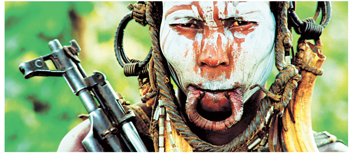
LES FILMS SÉVILLE

Transporté aux quatre coins du monde au gré d'un flot d'images superbes, sans narration ni indication, on s'im-