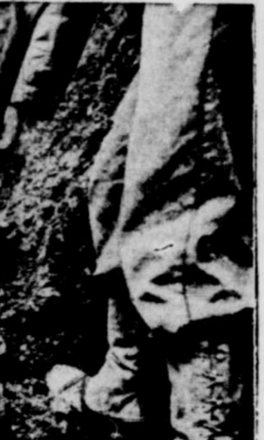
Il avait un message de compassion — Ce n'est pas un combattant, mais un messager de miséricorde, en uniforme mais sans armes, qui s'est risqué sur la ligne de feu et qui a été perdu dans la furie de l'attaque allemande contre la première armée dont il faisait partie du corps médical.

QUEBEC, 10. (P.C.) — L'imprésario J. A. Gauvin a été condamné à $15 d'amende, après avoir été trouvé coupable d'avoir donné un spectacle théâtral, le dimanche. La plainte avait été portée par le ministre du Procureur général.