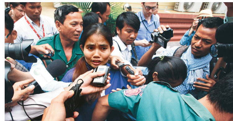
Yorm Bopha, une activiste cambodgienne