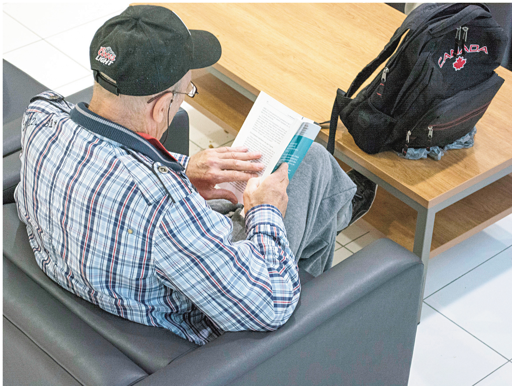
MICHAËL MONNIER LE DEVOIR

Rêver d'atteindre la retraite sans hypothèque sur sa propriété est de moins en moins réaliste.