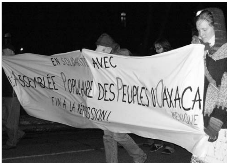
Québec : manifestation de soutien avec l'APPO.

La traversée dure deux, trois, quatre jours de marche, ou cinq nuits [...]. L'arrivée en Arizona est