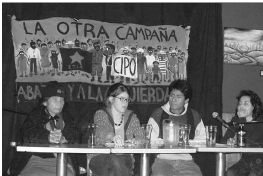
Conférence organisée à Québec en soutien au CIPO-RFM et à l'APPO.

ce jour le peuple héroïque d'Oaxaca a donné une leçon de civisme et de dignité au monde entier, la PFP a dû reculer devant la poussée de plus de 50 000 guerilleros qui, avec du bois, des pierres et des fusils à calibre lourd, se sont confrontés à des blindés, des hélicoptères et des fusils d'assaut. Ce furent des heures de lutte intense, des dizaines de compañeros furent blessés, beaucoup d'entre eux grièvement, des dizaines de détenus-disparus (dont des enfants), cependant le peuple d'Oaxaca a gagné cette première bataille. »