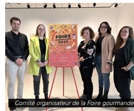
Comité organisateur de la Foire gourmande

La scène de rue ainsi que la zone familiale seront de retour et animeront petits et grands tout au long de l'événement.