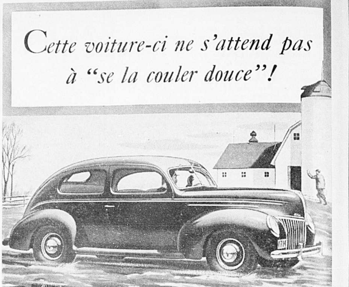
LE TUDOR DE LUXE V-8 FORD DE 1939

Voici une V-8 Ford de 1939 à qui l'on fera la vie dure, et sur des chemins souvent impraticables... mais elle saura défier les pires contretemps, car sa supériorité définitive s'appuie sur l'expérience acquise par la Sté Ford dans la fabrication de millions d'automobiles, et elle a été soumise à toutes les épreuves qu'a pu concevoir la science moderne dans le but de repérer les moindres déficiences. Nous dépons des montants considérables pour obtenir la certitude que votre V-8 Ford vous donnera de longues années de "service" irréprochable. Nous sommes fiers de fabriquer la V-8 Ford et nous voulons que nos clients en soient intégralement satisfaits. Demandez une démonstration pratique à notre plus proche dépositaire.