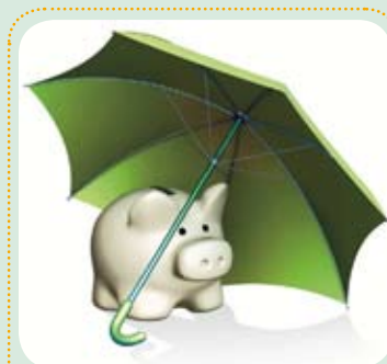
Le logo de la campagne « Une retraite à l'abri des soucis » initiée par la Fédération des travailleurs et travailleuses du Québec.

Dans un deuxième temps, une assurance devrait être créée pour garantir la rente des travailleurs et des travailleuses des entreprises devenues insolubles.