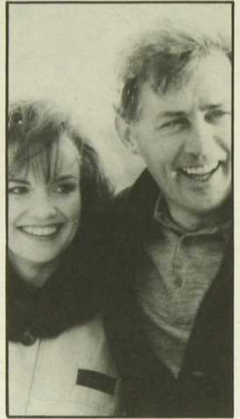
Blair Brown et Martin Sheen