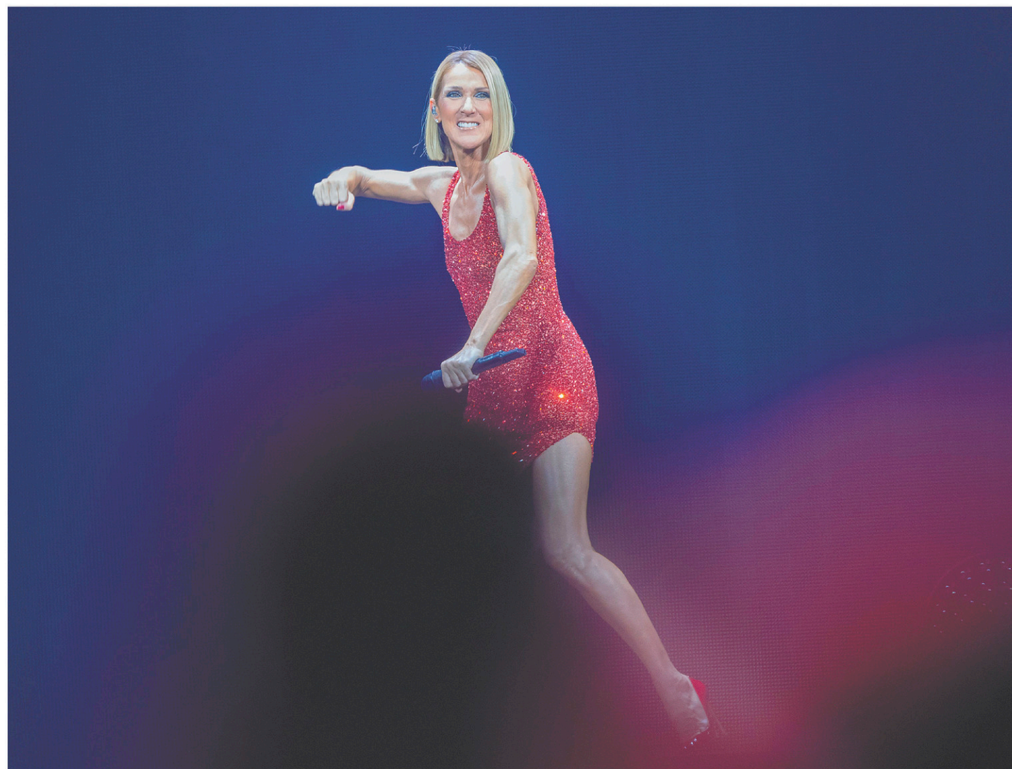
Céline Dion a amorcé lundi soir sa série de quatre concerts prévus à Montréal, dans le cadre de sa tournée Courage . À la fin du mois de septembre, elle avait été contrainte de reporter les représentations en raison d'un virus. La tournée mondiale de la chanteuse s'arrêtera dans plus de 50 villes au Canada et aux États-Unis. VOIR PAGE B 3