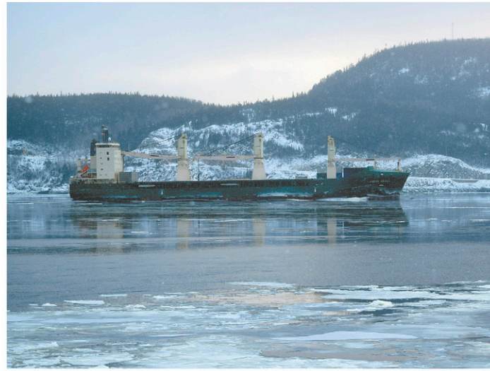
Un navire dans le fjord du Saguenay

Un avis d'expert du ministère de la Santé et des Services sociaux publié lui aussi la semaine dernière estime que GNL Québec devrait fournir des données historiques sur les émissions de GES du Québec, « afin de pouvoir apprécier l'impact du projet dans la lutte contre les changements climatiques ».