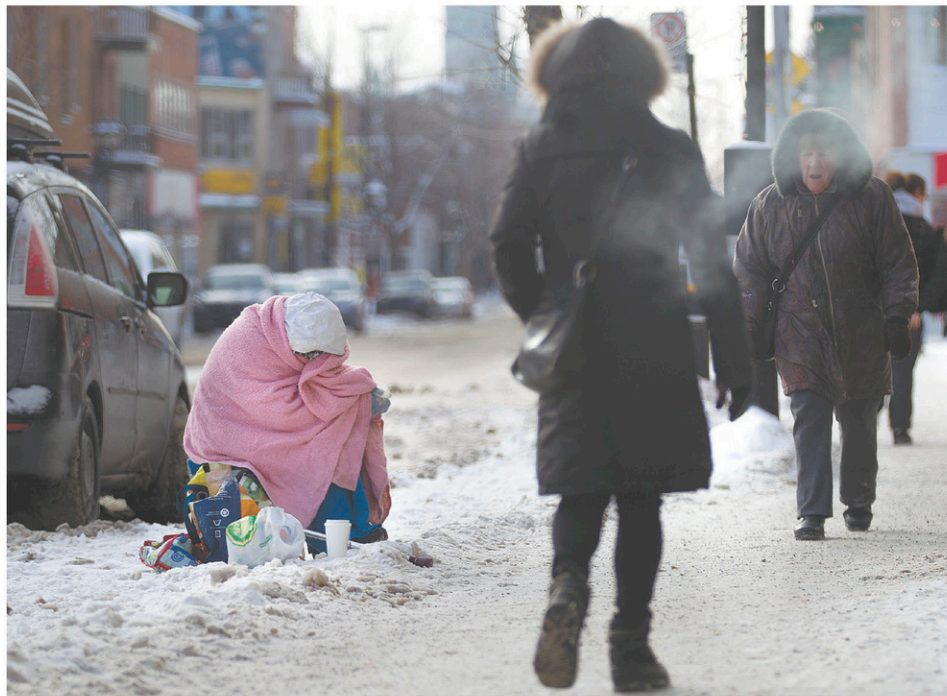
L'accès aux refuges est encore difficile à Montréal.

Rappelons qu'en période hivernale, les haltes-chaleur et l'unité de débordement offrent une solution aux personnes itinérantes qui sont réfractaires, restreintes ou bannies dans les refuges d'urgence en place. Il s'agit