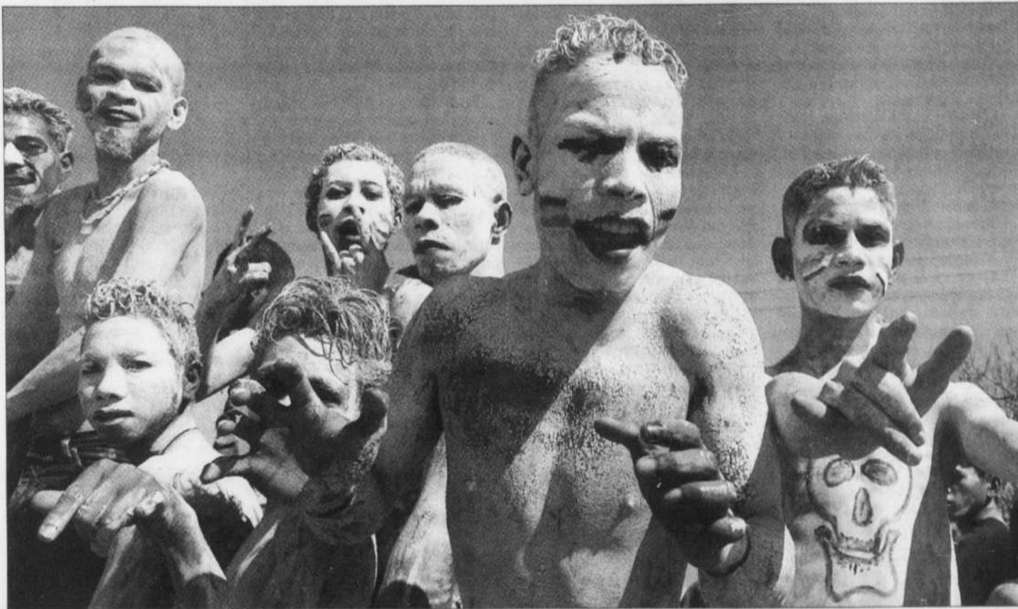
À l'annonce de la démission d'Alkatiri, les Timorais ont explosé de joie, tapant sur tambours et casseroles pour marquer leur satisfaction.