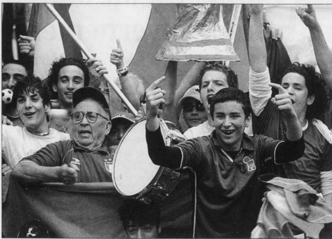
Dans la Petite Italie, à Montréal, les Italiens ont célébré en grand la victoire de leur équipe contre l'Australie.