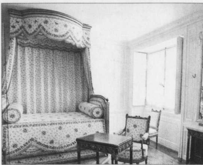
Une chambre du Trianon, la résidence privée de Marie-Antoinette à Versailles.

riel, le Petit Trianon avait été offert à la reine par Louis XVI en 1774 comme cadeau de mariage.