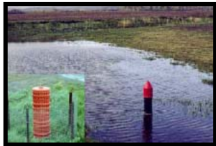
Contrôle de l'érosion