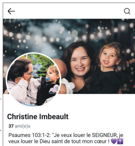
Le fraudeur a utilisé un faux profil pour arnaquer des Baie-Comois.

La Baie-Comoise est rapidement entrée en contact avec le faux profil au nom de Christine Imbeault. «Elle