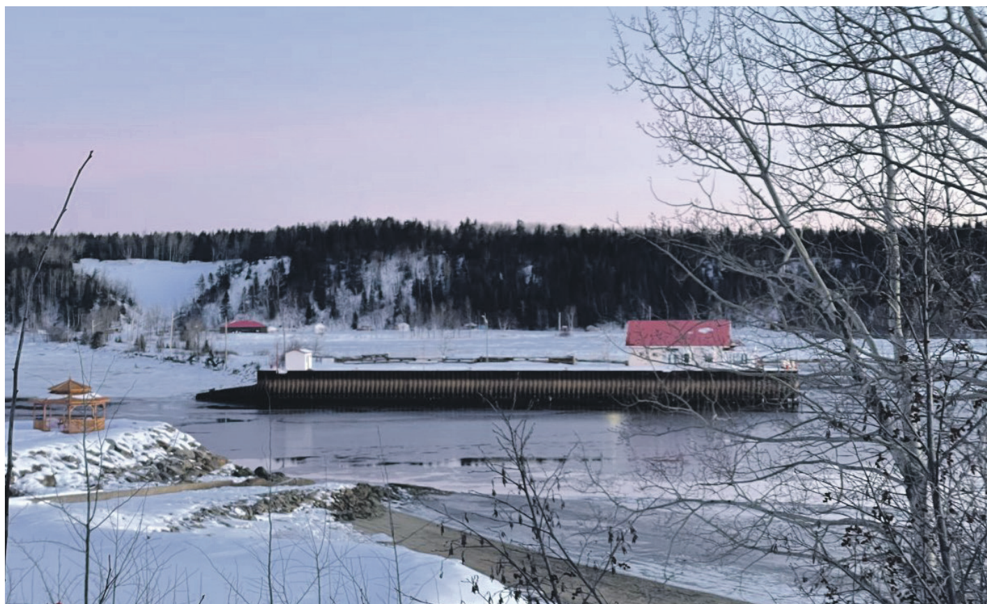
Un nouveau restaurant verra le jour en 2025 à la marina de Portneuf-sur-Mer.

Comme son nom Saloon l'indique, l'établissement se voudra un restaurant de style pas trop compliqué avec un menu accessible et peut-être