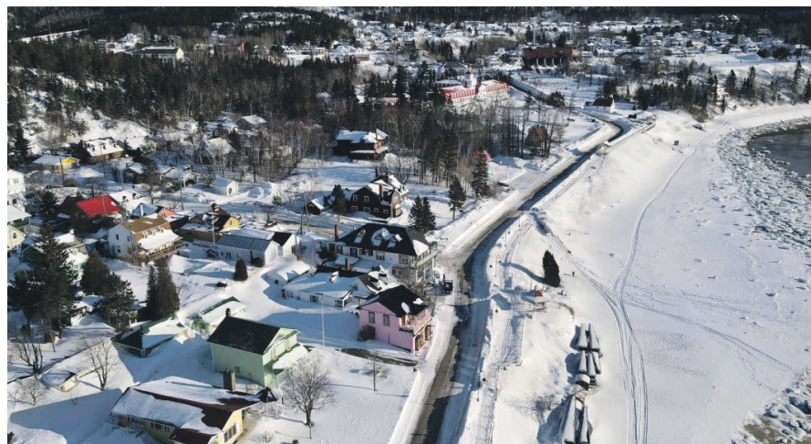
La Municipalité de Tadoussac prévoit des investissements de 23,5 M$ dans le cadre de son programme triennal d'immobilisations.

La toiture de la Maison du Tourisme sera réparée pour une somme de 350 000 $ en 2025, et la réfection extérieure de l'Hôtel de ville bénéficiera de 150 000 $ en 2026.