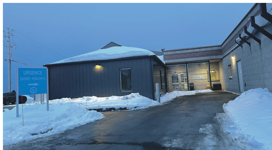
Deux nouveaux médecins et un retour de congé de maternité sont attendus en 2025 à l'urgence de Forestville.