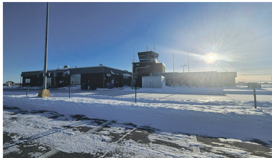
Air Liaison pourrait décider de plier bagage à la suite de la décision de la MRC de Manicouagan.

«Si on ne va pas tester le marché [maintenant], on ne pourra jamais y aller. On est dans une période où l'effervescence économique pourrait faire en sorte que d'autres transporteurs pourraient être intéressés», soutient-il.