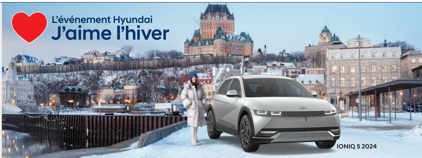
IONIQ 5 2024