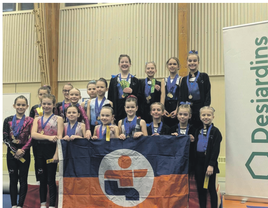
Près de 40 gymnastes ont compétitionné à Portneuf-sur-Mer le 11 janvier. Voici les participantes du bloc 1.