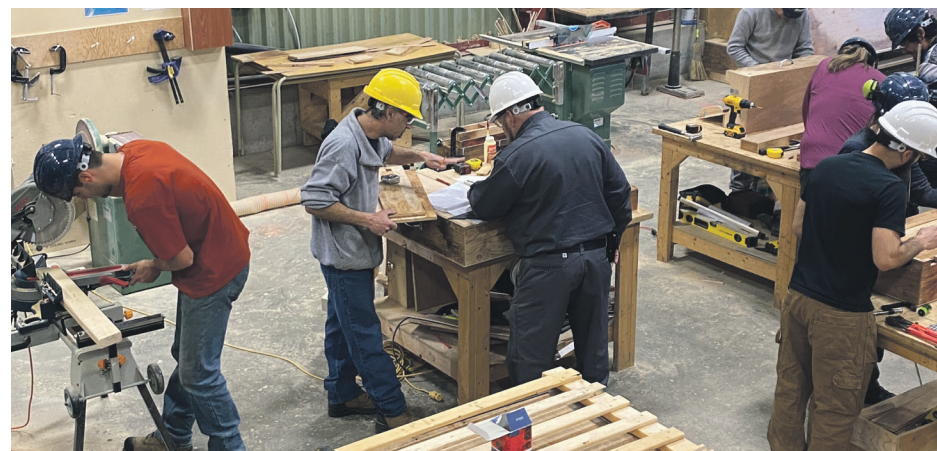
Le CFP de l'Estuaire a formé cinq cohortes en charpenterie-menuiserie depuis le lancement de l'offensive de formation en construction il y a un an.

Alors que le gouvernement annonçait, en novembre, la fin du projet de formations accélérées en construction, le CFP et le SAE de l'Estuaire se réjouissent de l'obtention de cette dernière cohorte accordée par le ministère de l'Éducation.