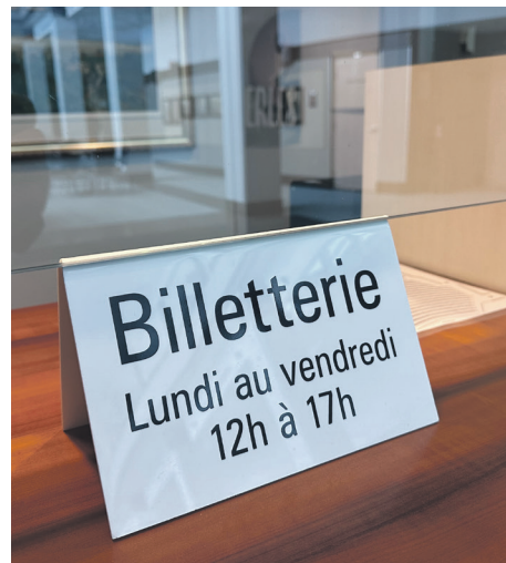
La billetterie du Centre des arts de Baie-Comeau est ouverte cinq jours par semaine en après-midi.

Une chose est sûre, le diffuseur baie-comois prend la situation au sérieux et ne ménagera pas ses efforts pour trouver des moyens de contrer ce fléau. «On va prendre des actions et ce serait bien que la police travaille en concertation avec nous», conclut la directrice.