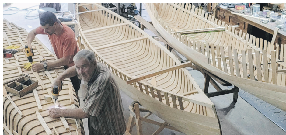
Les canots de cèdre en toile de l'expédition en construction.

Au-delà du dépassement de soi, l'expédition vise également à mettre la légende autour de cette route sur la carte. «C'est un peu comme le chemin de Compostelle en Europe ou le Appalachian Trail aux États-Unis. C'est l'appel d'une grande aventure, et ça pourrait peut-être attirer les gens pour une forme de tourisme culturel et de plein air éventuellement», estime le féru d'aventure.