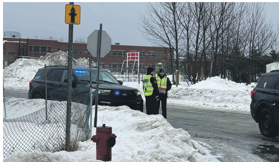
Le 17 décembre, la Sécurité publique de Pessamit a participé à l'opération nationale concertée ciblant la capacité de conduire affaiblie par l'alcool ou la drogue.

Au total, la Sécurité publique de Pessamit a ouvert 530 dossiers criminels et 1496 dossiers d'activités. « Ces statistiques sont un record depuis notre création en 1997 », écrit l'organisation policière sur ses réseaux sociaux.