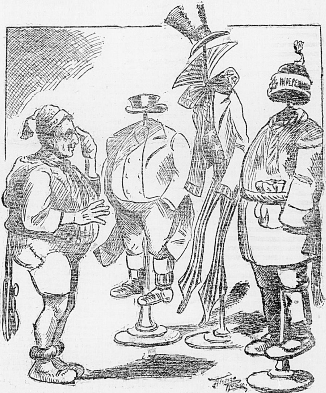
LE CANADA. — Me voilà homme maintenant et il me faut un habit neuf. Lequel vais-je choisir ? Celui de l'impérialisme est trop large et pas assez long ; celui de l'annexion est trop long et pas assez large ; je crois qu'une bonne tuque et un capot d'étoffe, sont encore ce qui m'irait le mieux.