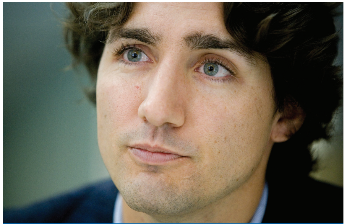
Justin Trudeau

Pour faire suite à mon premier article, à propos des compétences de nos chefs d'État, je n'ai pu m'empêcher de lui poser la question: «Puisque vous avez étudié en arts et en éducation, croyez-vous que de ne pas avoir étudié en droit ou en économie, comme la plupart