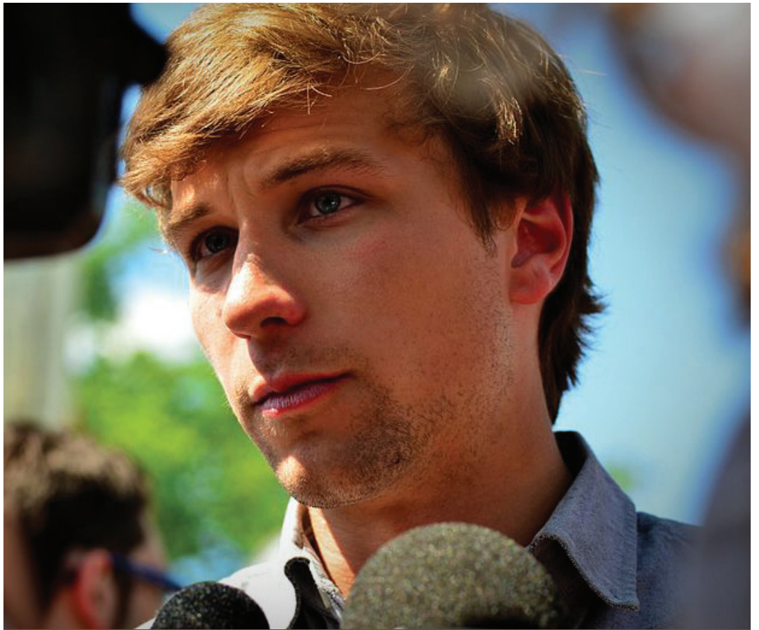
Gabriel Nadeau-Dubois

Ainsi, même si le geste de Gabriel Nadeau-Dubois n'a pas eu de répercussions catastrophiques, le même geste, reproduit en plus grand nombre, engendrerait une perte de confiance en la justice. Un climat de méfiance envers autrui régnerait puisque personne ne pourrait se fier à une quelconque législation et la seule loi en place serait celle du plus fort.