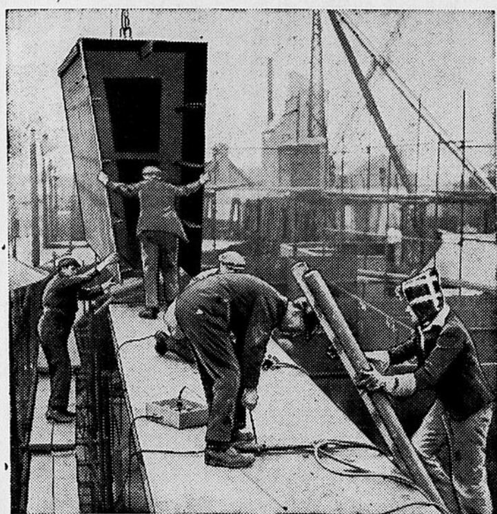
Des ouvriers des chantiers maritimes Henry Scarr, à Hull, en Angleterre, assemblent les parties d'un navire.

EN ANGLETERRE, ON CONSTRUIT DES NAVIRES EN ASSEMBLANT LES PARTIES FABRIQUEES A L'AVANCE