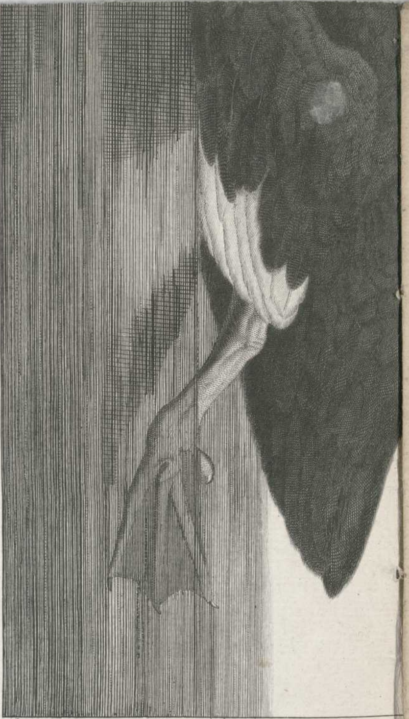
Atlas du Voyage à la recherche de la Pérouse, N° 9.