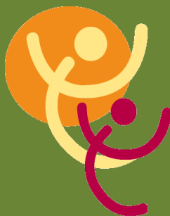
Table de concertation des groupes de femmes de la