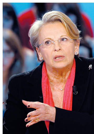
La chef de la diplomatie française, Michèle Alliot-Marie, a voyagé à deux reprises à bord du jet privé d'un chef d'entreprise lié au clan Ben Ali.

Sa défense s'est trouvée mise à mal samedi quand Le Nouvel Observateur a révélé que Mi-