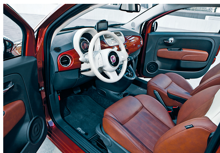
La décoration intérieure plaira aussi aux amateurs de design, avec son mariage harmonieux des styles moderne et rétro.