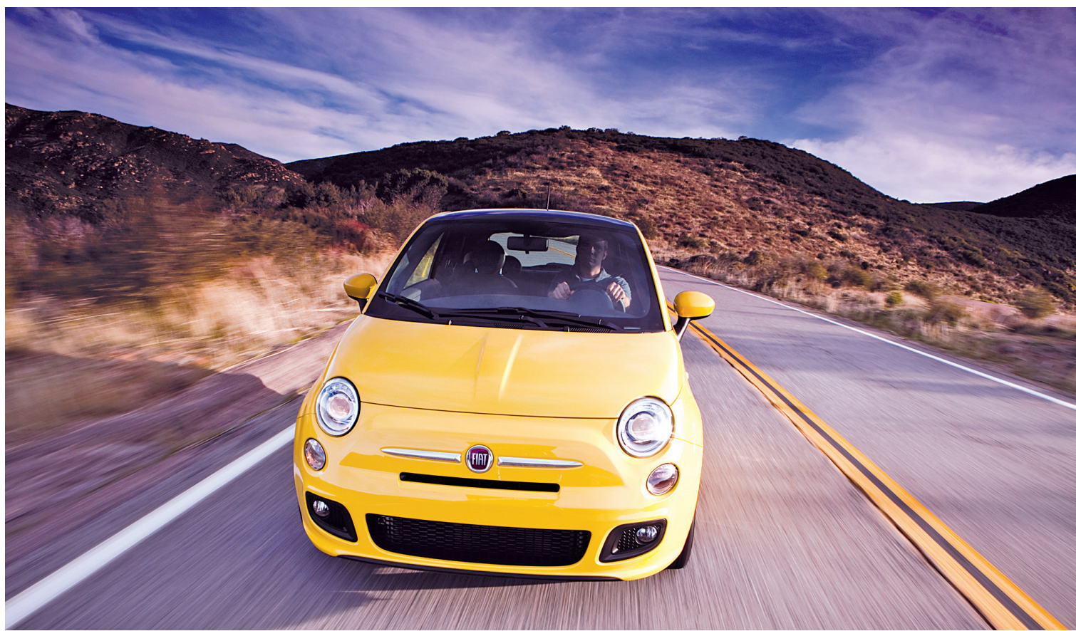
La Fiat 500 s'inspire d'un modèle qui a écrit une page d'histoire de l'automobile et mise sur la nostalgie — un outil de marketing très efficace — et le design.

Lors d'une présentation à San Diego la semaine dernière, l'auteur de ces lignes a pu conduire la Fiat 500 pendant quelques heures. Évidemment, les routes californiennes ressemblent à un parquet ciré, ce qui n'a rien à voir avec les nôtres; un essai prolongé, dans nos conditions, donnera l'heure juste, mais la première impression est bonne. D'abord, la 500 est une réussite esthétique, ce qui ne nuit jamais aux ventes. Fortement inspirée