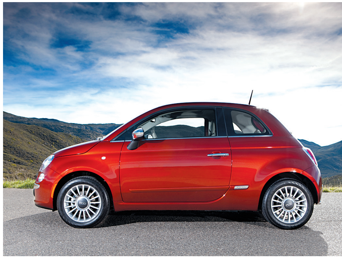
Fiat revient par la grande porte, même si sa gamme ne compte, pour l'instant, qu'un seul modèle en Amérique du Nord.

Prédiction du chroniqueur: chez nous, la Fiat 500 va faire un tabac. Les dirigeants de Chrysler Canada semblent penser la même chose puisque 25 des 67 concessionnaires canadiens sont au Qué-