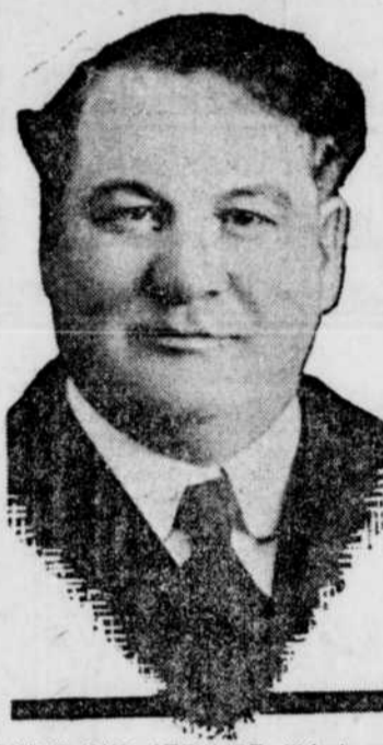
L'HON. C.M.S. STEWART, libéral, qui vient de former un nouveau cabinet en Alberta.