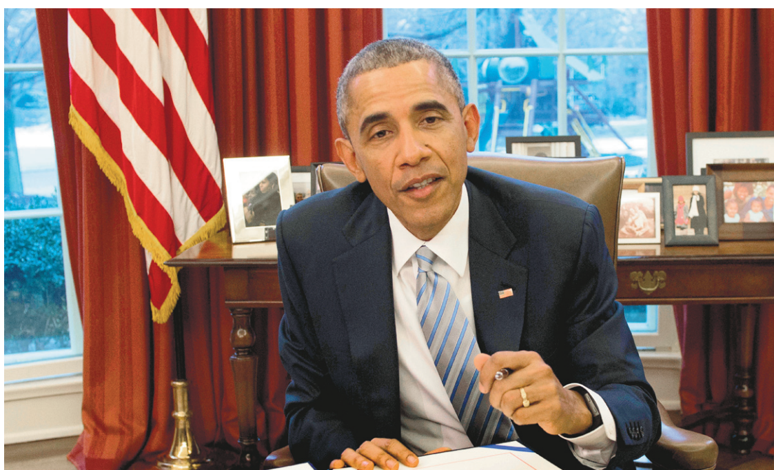
Les relations entre Barack Obama et Benjamin Nétanyahou n'ont jamais été très amicales.