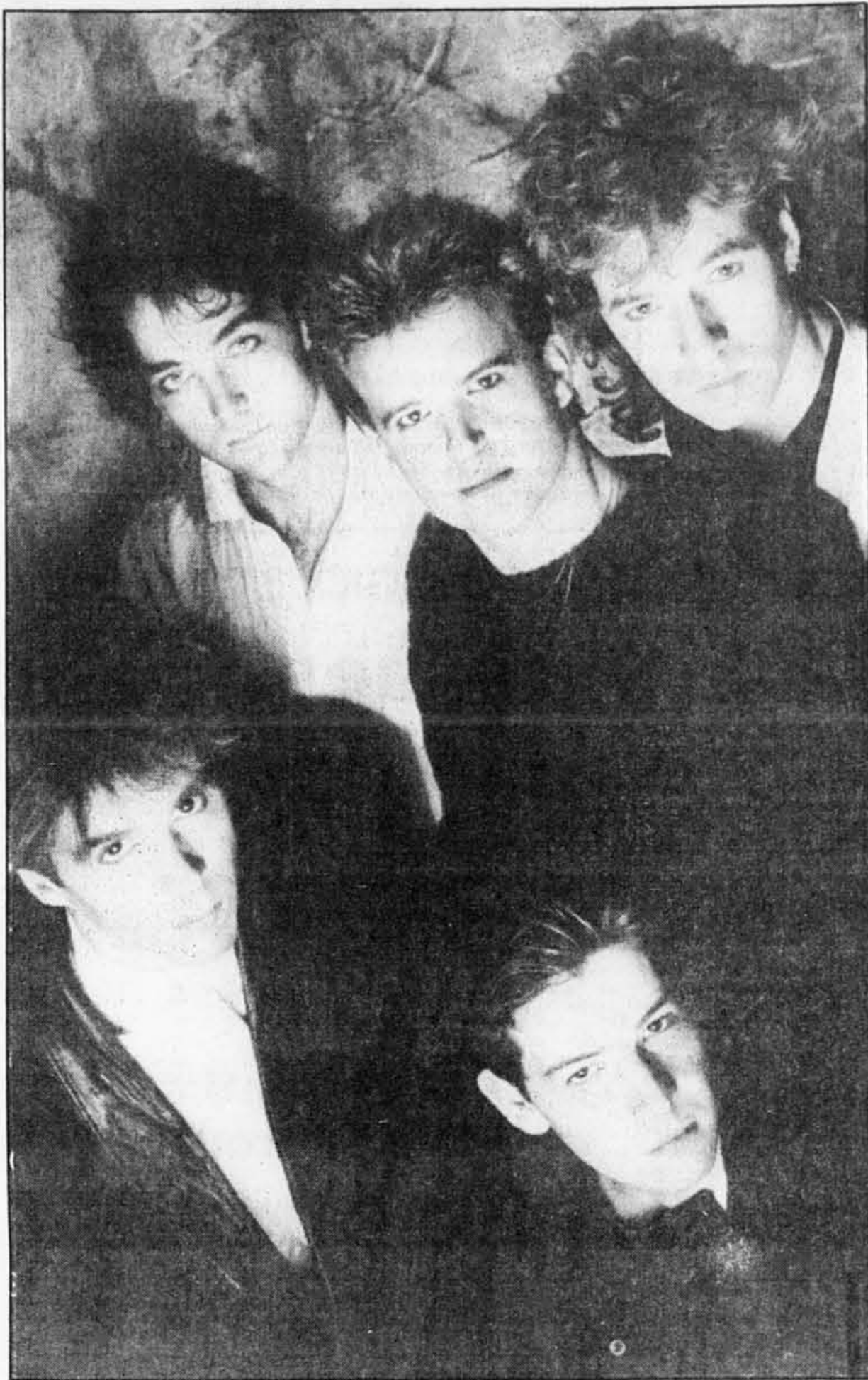
Le groupe rock Glass Tiger a remporté trois Junos, dont ceux du meilleur album et du meilleur 45 tours.

vente. Les gagnants sont choisis par vote par les membres de l'académie, formée en grande partie de cadres de l'industrie de la musique.