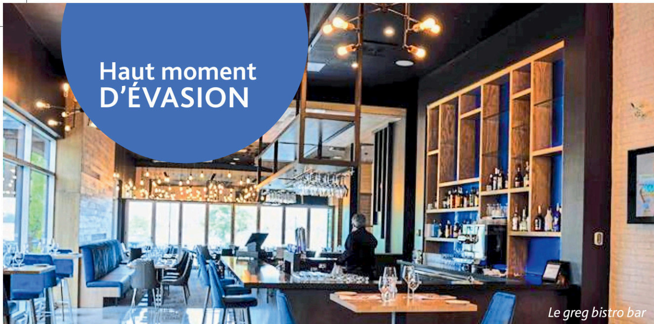
Le greg bistro bar