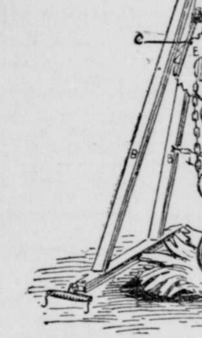
Arrache-pierres et souches à roue dentée. Les gravures suivantes représentent un excellent instrument pour arracher

Le défoncement fait, la terre bien ameublée et bien nivelée, on enfonce à