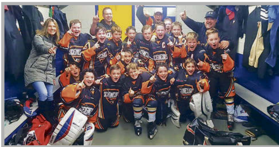
► Les Seigneurs au moment de leur qualification.

Il s'agissait de la troisième participation