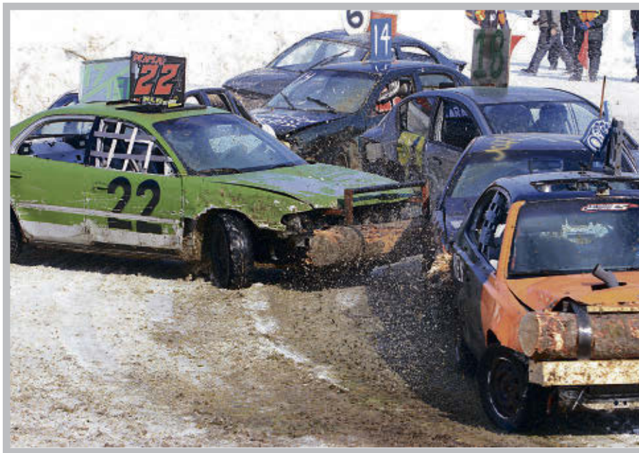
› Les spectateurs étaient au rendez-vous le 23 février.