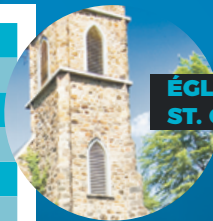
ÉGLISE ST. GEORGE