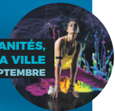
URBANITÉS, L'ART DANS LA VILLE 29 SEPTEMBRE