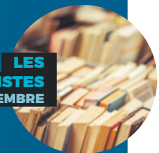
LES BOUQUINISTES 7 AU 9 SEPTEMBRE