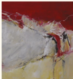
Benoit Genest Rouillier, Tristesse, 2016, acrylique sur toile, 76 x 153 cm

Mardi au dimanche, de 13 h à 17 h Soirs de spectacles, de 19 h à 21 h 30 ACCÈS GRATUIT