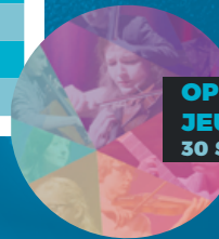
OPUS, JEUNES VIRTUOSES 30 SEPTEMBRE

POUR PLUS D'INFORMATIONS DRUMMONDVILLE.CA/EVENEMENTS 819 478-6550