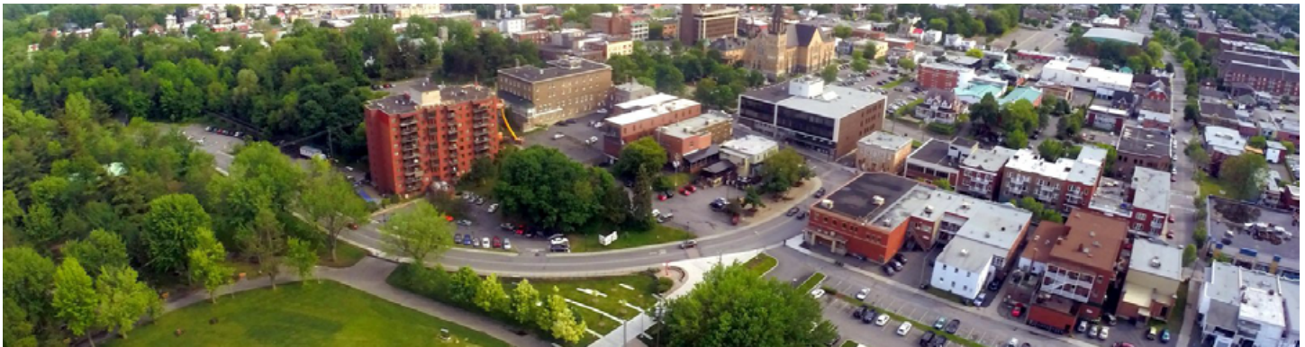
Le parc Woodyatt et la place Saint-Frédéric sont parmi les endroits où il sera interdit de consommer du cannabis.

Concernant les amendements au règlement de zonage, ceux-ci entreront en vigueur le 12 septembre 2018.