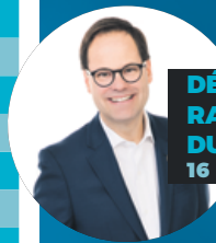
DÉFI SANTÉ RANDONNÉE DE VÉLO DU MAIRE 16 SEPTEMBRE