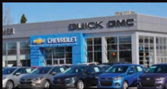
AUTOMOBILES CARMER CHANDLER