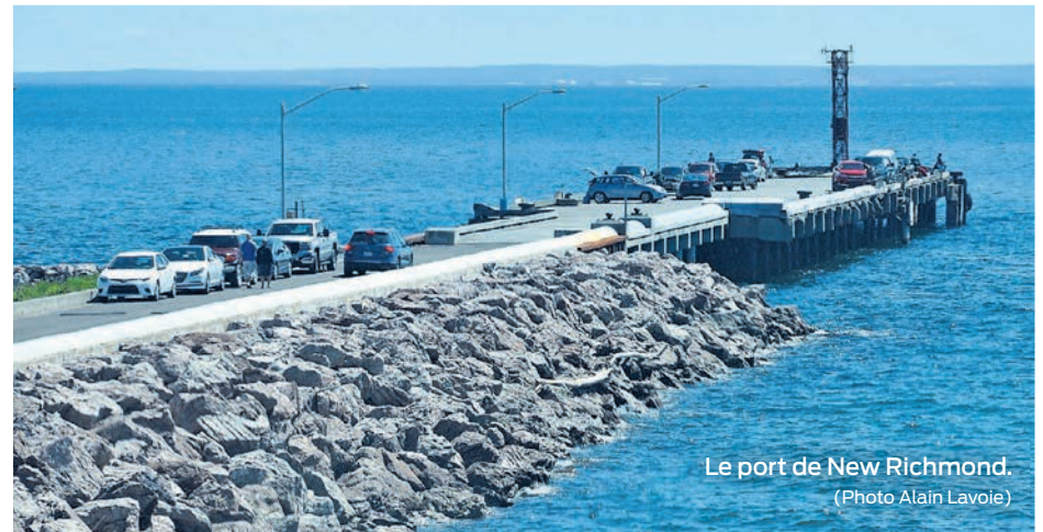
Le port de New Richmond.

un client majeur est identifié comme futur utilisateur du quai de New Richmond. Fabrication Delta, spécialisée dans la fabrication de tours d'éoliennes et de structures lourdes d'acier de toute envergure, envisage de participer à des appels de propositions et d'offrir ses services pour fabriquer des pièces surdimensionnées difficiles à transporter par voie terrestre et ferroviaire. »