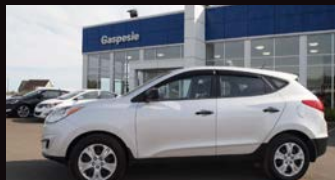
GASPÉSIE AUTO HYUNDAI BONAVENTURE