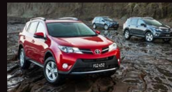
TOYOTA BAIE-DES-CHALEURS CAPLAN