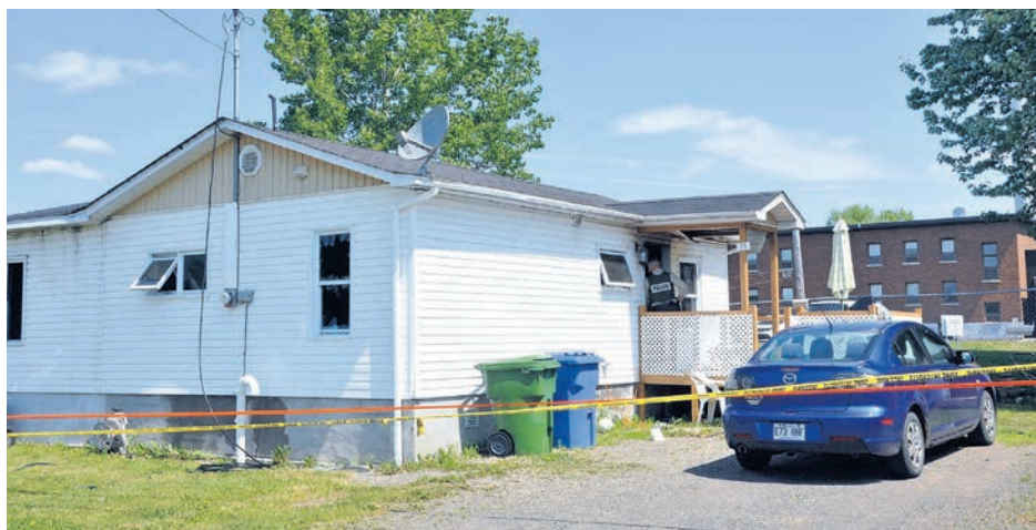
Voici cette résidence incendiée de la rue des Merles à Maria.

« Jusqu'à présent, aucun élément criminel n'a été relevé », précise M me Nepton qui ajoute que « la victime est un homme dans la quarantaine, résident des lieux. Il était seul au moment des événements. » (A.L.)