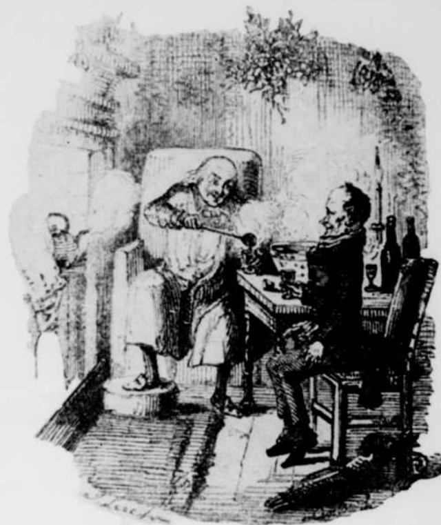
Illustration figurant dans la 1 re édition du « Chant de Noël ».

L E CHANT DE NOËL de Charles Dickens sera entendu au réseau français de Radio-Canada les 21, 22, 23, 24 et 25 décembre, de 8 heures à 8 h. 30 du soir.