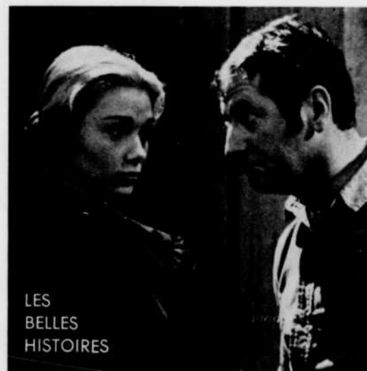
LES BELLES HISTOIRES