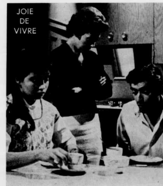
JOIE DE VIVRE