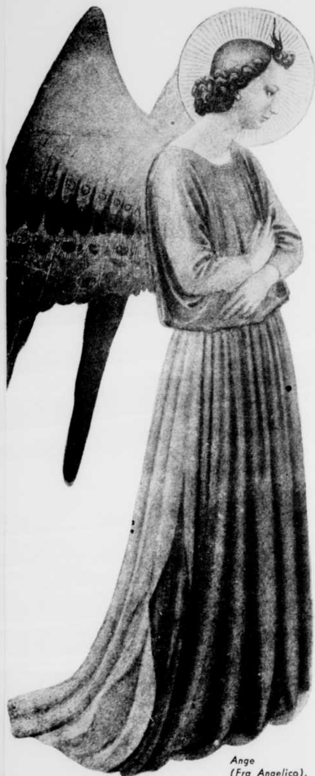
Ange (Fra Angelico).