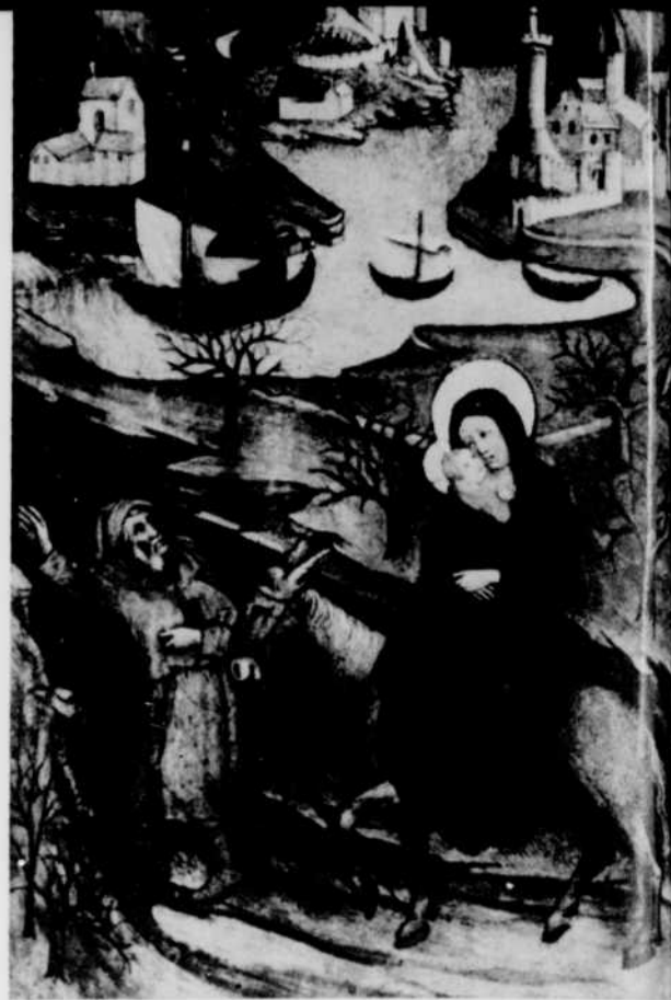
Heures du duc de Berry (XIV e siècle).

Le poème, de Berlioz lui-même, est écrit dans une langue simple, archaïsante à souhait, qui