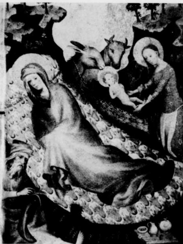
Nativité (École de Bourgogne, XIVe siècle).