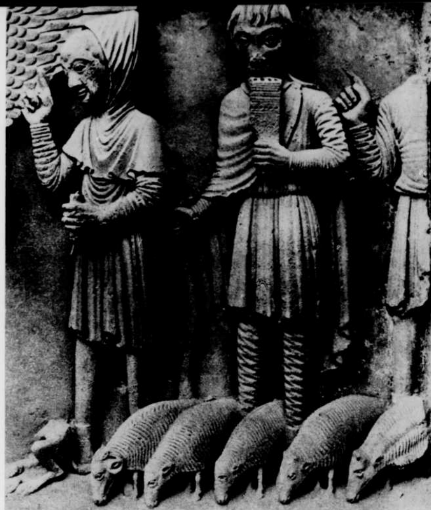
Bergers beaucerons, Chartres (XIIe siècle).