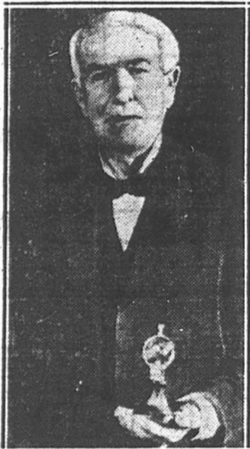
Edison tient ici dans sa main la première lampe à incandescence, l'une de ses plus merveilleuses inventions.

EDISON n'était pas brillant à l'école, bien au contraire. Timide et craintif, il n'obtenait pas de ses maîtres la sympathie qu'il lui fallait. Ces derniers, d'ailleurs, trouvaient insensées toutes les