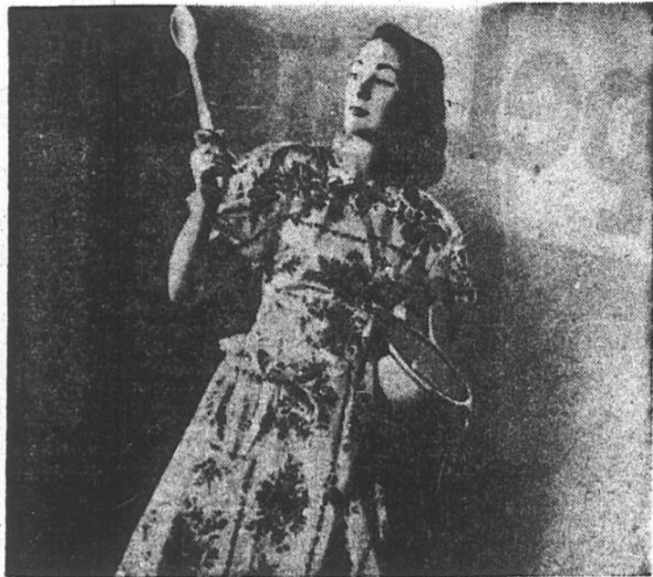
Il est merveilleux de constater chaque jour les merveilles que l'après guerre nous dispense graduellement et les tissus nouveaux maintenant sur le marché nous combient de ravissement. La robe que nous illustrons ici est en Chinsette, un tissu remarquable qui est lavable, inaltérable et dont le fini satiné est permanent.