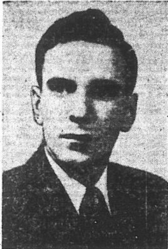
M. Jean Duceppe qui sera en vedette dans la nouvelle comédie de Paris, "Pouche", de René Peter et Henri Falk présentement à l'affiche de l'Arcade.