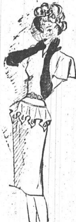
Le crêpe blanc fait de charmantes robes d'été, mais il est également employé pour ces occasions spéciales où une toilette particulièrement habillée est indiquée. Un piquant petit péplum est attaché à la jupe au moyen de boutons dorés, une couleur que répète la ceinture de cuir. Les manches sont courtes, l'encolure en forme de V. Une robe qui se portera indifféremment avec des accessoires noirs ou bruns.