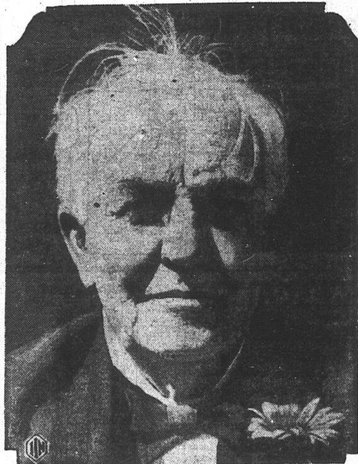
Cette photo de Thomas-Alva Edison a été prise peu avant sa mort survenue le 18 octobre 1931.

pour obtenir un emploi. Il arrive au moment même où le patron est furieux parce que le "ticker" (télégraphe imprimeur) ne fonctionne plus et que personne n'est capable de le réparer. Edison offre de le remettre en marche et, au bout de peu de temps, l'appareil fonctionne comme auparavant. Immédiatement il est engagé comme surintendant au salaire de $300 par mois. Cette offre fut probablement la plus grosse surprise de toute la vie de l'inventeur.