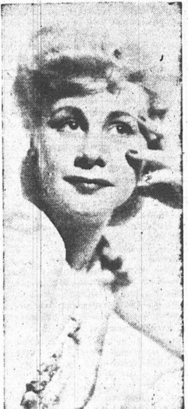
La très jolie Diane Raye, danseuse-vedette du Broadway qui sera présentée en tête d'affiche dans la revue "Red Hot and Blue", dès lundi à la scène du Gayety.