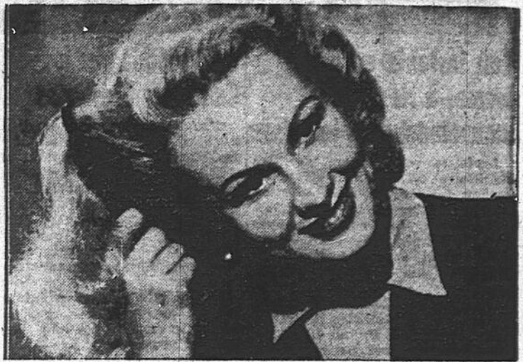
Virginia Mayo qui faisait ses débuts avec Bob Hope dans "The Princess and the Pirate" est protagoniste de Danny Kaye dans "Wonder Man", comédie spectaculaire technicolore actuellement à l'affiche au cinéma Loew's.