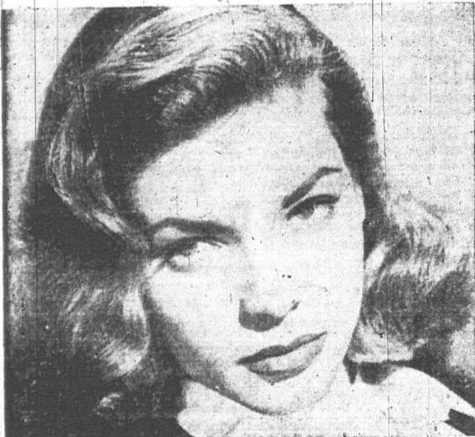
Lauren Bacall qui s'est élevée au rang de vedette avec son tout premier film "To Have and Have Not", est la partenaire romantique de Charles Boyer dans le film Warner "Confidential Agent", actuellement à l'affiche en seconde semaine au cinéma Palace.