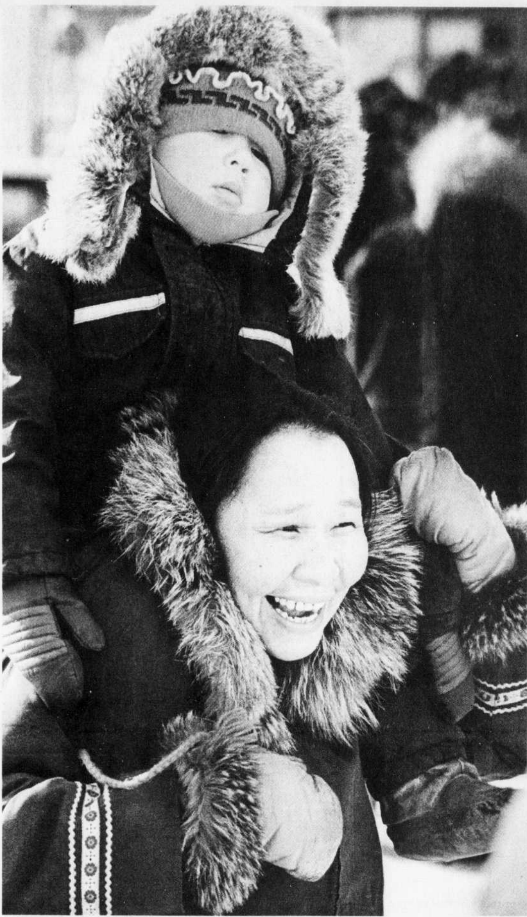
Femme Inuit et son enfant.

Cette rencontre de deux jours a permis de dégager les grandes préoccupations des femmes élues de l'APNQL. Parmi ces préoccupations, il y a notamment le sous-financement de l'éducation, le manque criant de logements dans les réserves,