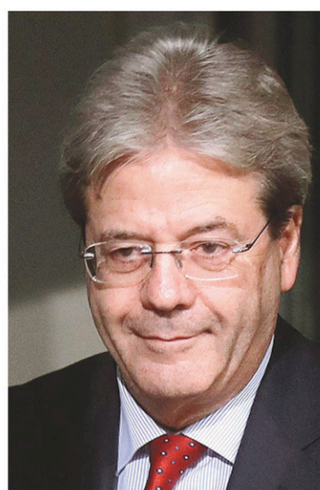
Le premier ministre de l'Italie, Paolo Gentiloni

L'an dernier, le sauvetage public de quatre petites banques avait entraîné des pertes lourdes pour des mil-