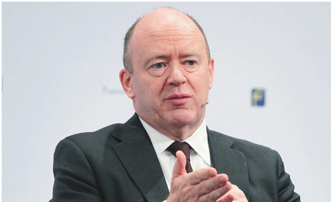
Le p.-d.g. de la Deutsche Bank, John Cryan

L'évocation de cette amende record avait réveillé les craintes à la fois sur la santé du secteur bancaire européen et sur une nouvelle débâcle financière comme celle engendrée en 2008 par la chute de Lehman Brothers. Un plongeon de Deutsche Bank, institut de premier plan présent partout dans le monde et dans presque toutes