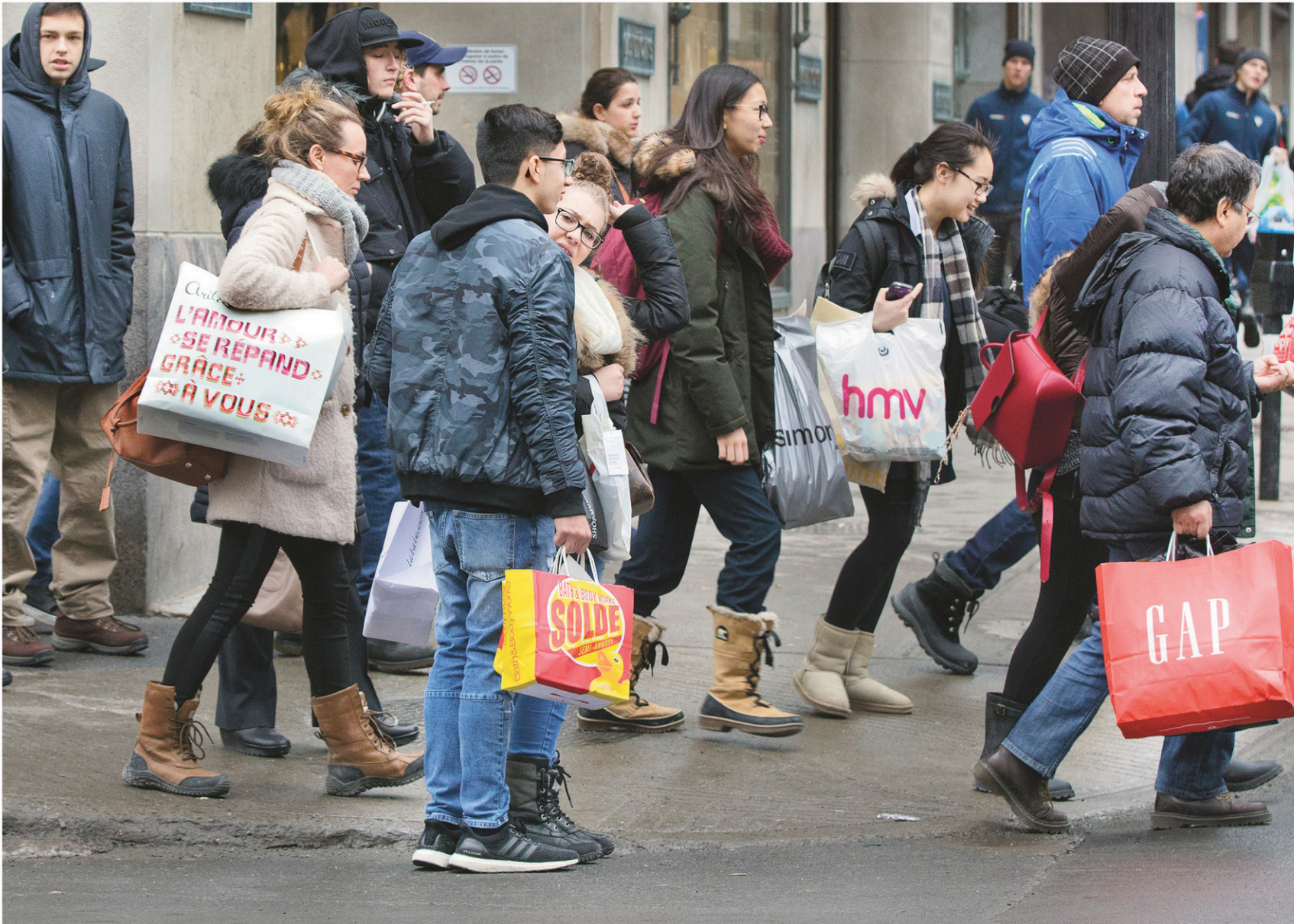
Scène de rue à Montréal en cette journée de fort achalandage du 23 décembre

CAHIER C • LE DEVOIR, LES SAMEDI 24 ET DIMANCHE 25 DÉCEMBRE 2016