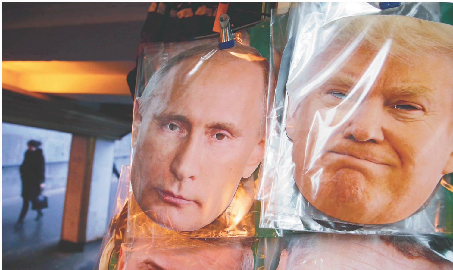
Des masques à l'effigie de Vladimir Poutine et de Donald Trump sont vendus dans un kiosque de souvenirs à Saint-Petersbourg.

«Il y a des pays qui parlent en ce moment d'augmenter leurs capacités nucléaires. Les États-Unis ne vont pas observer ça de loin et permettre que cela arrive sans agir en conséquence», a précisé sur CNN