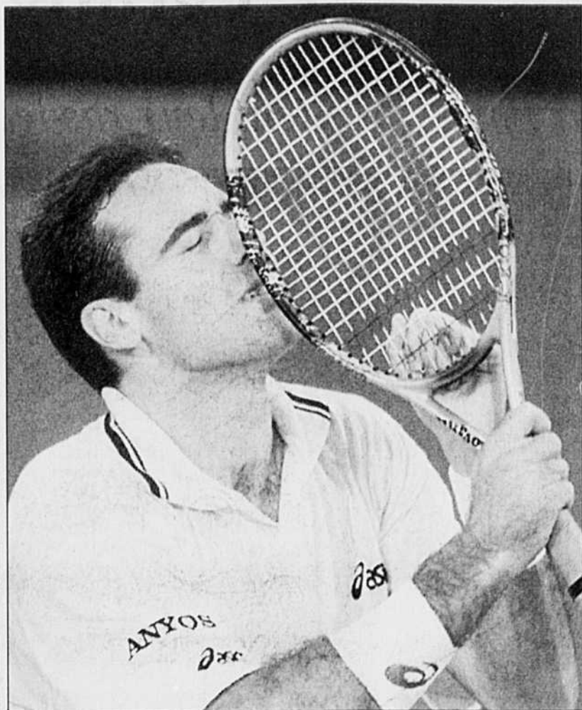
L'Espagnol Alex Corretja embrasse sa raquette après s'être imposé face à son compatriote Carlos Moya en cinq manches de 3-6, 3-6, 7-5, 6-3 et 7-5, hier, à Hanovre.