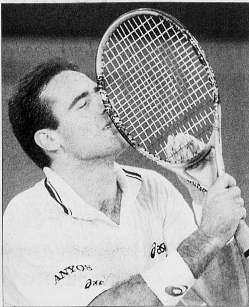
L'Espagnol Alex Corretja embrasse sa raquette après s'être imposé face à son compatriote Carlos Moya en cinq manches de 3-6, 3-6, 7-5, 6-3 et 7-5, hier, à Hanovre.