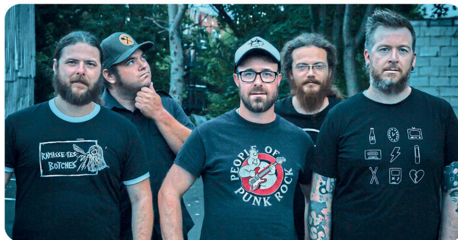
Le groupe Slater & Fils présente deux spectacles, le 23 juin, à Venise-en-Québec.

Les festivaliers auront également droit à un spectacle pyrotechnique, dès 22h, sur les eaux du lac Champlain.