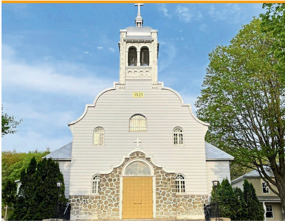
L'église catholique Saint-Philippe, située sur l'avenue Champlain à Saint-Armand, a été érigée en 1921.