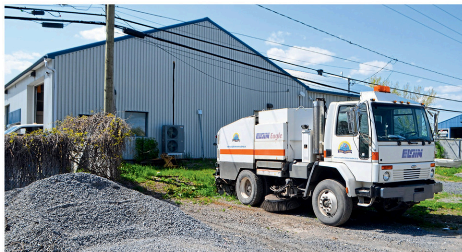
Venise-en-Québec prévoit un agrandissement de 60 pi par 100 pi au garage municipal.