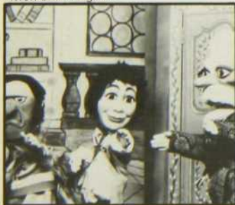
«Les Aventures de Oui-Oui»