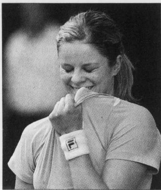
DAVID GRAY REUTERS

«On a un peu parlé dans le vestiaire avant le match», a déclaré Clijsters après la sortie du court