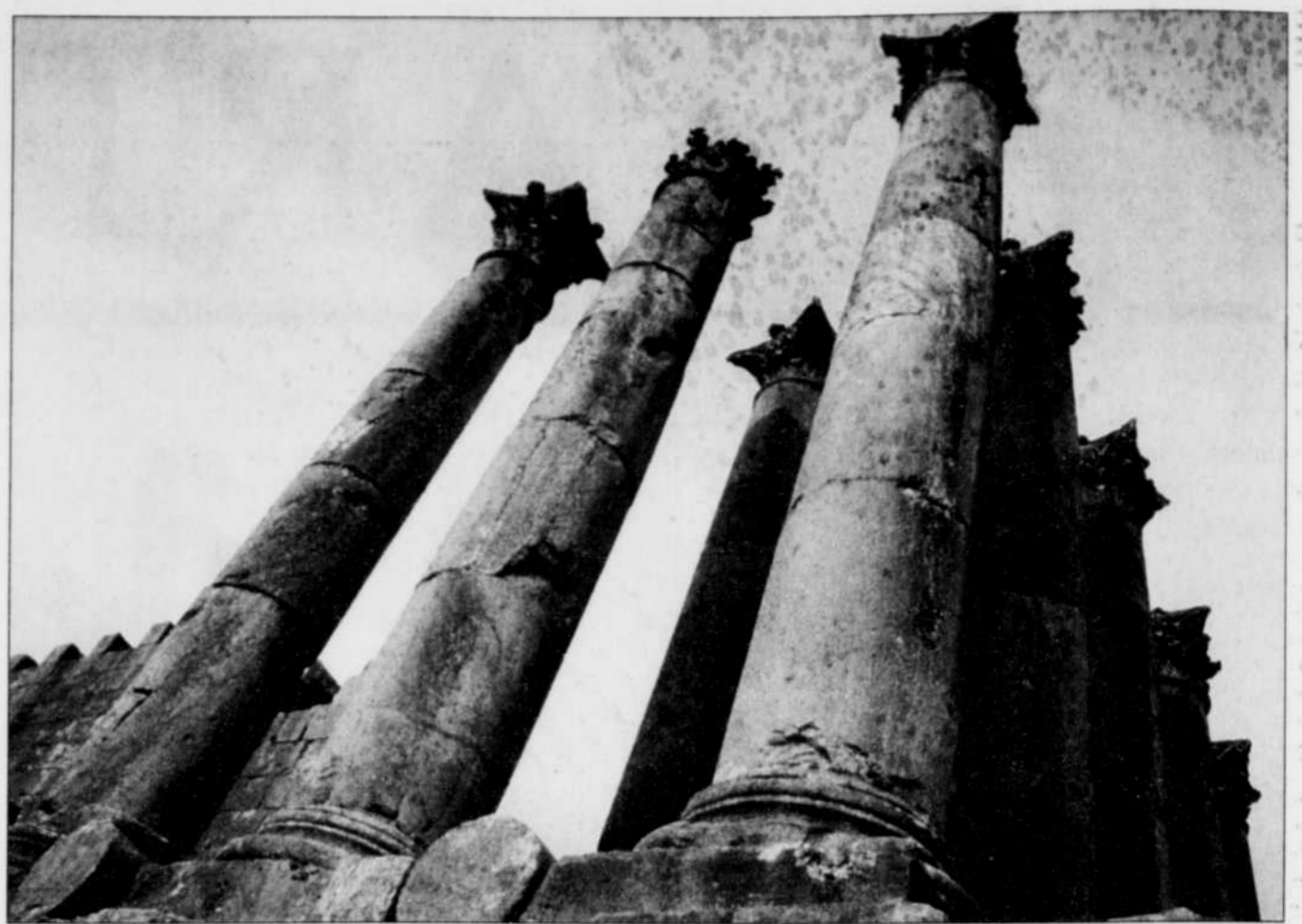
À une cinquantaine de kilomètres d'Amman, les ruines de Jerash ne laisseront personne de marbre.

blement heureux d'enfin accueillir chez eux leurs voisins et ex-ennemis depuis la création, en 1948, de l'État