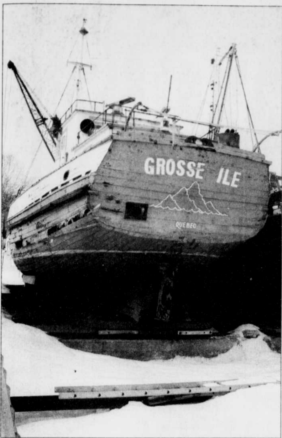
La «Grosse-Île» sera restaurée aux chantiers de Saint-Joseph-de-la-Rive.