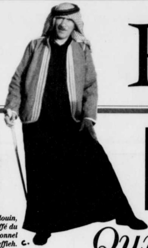
Un bédouin, coiffé du traditionnel keffiyeh.