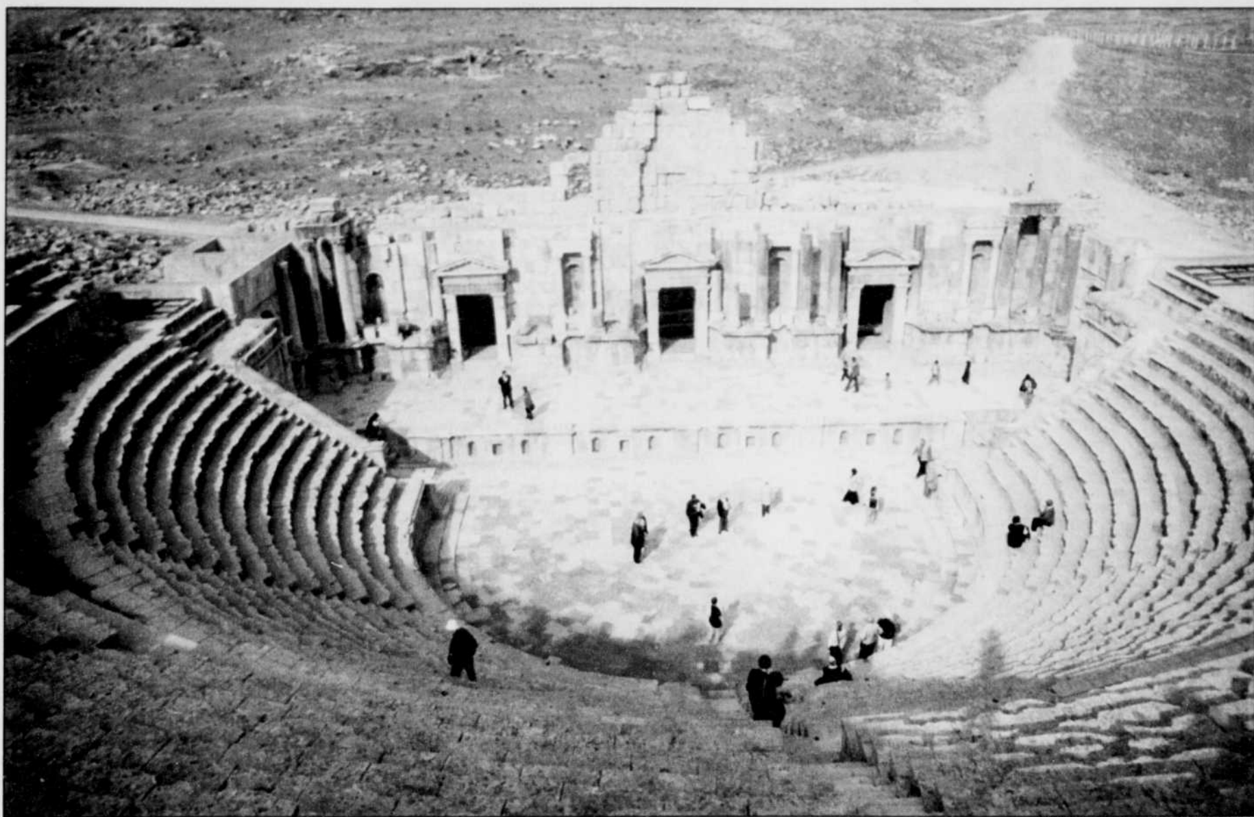
Jerash présente les ruines d'une des cités provinciales romaines les mieux conservées au monde.

En route pour Aqaba, il faudra enfin s'arrêter à Wadi Rum où, au cœur d'une plaine désertique, se dressent de magnifiques formations rocheuses, comme si les rideaux de pierre d'un théâtre géant s'ouvraient sur le pays des Bédouins et les exploits de Lawrence d'Arabie qui, comme cela vous arrivera sans doute, tomba amoureux de cet adorable pays.