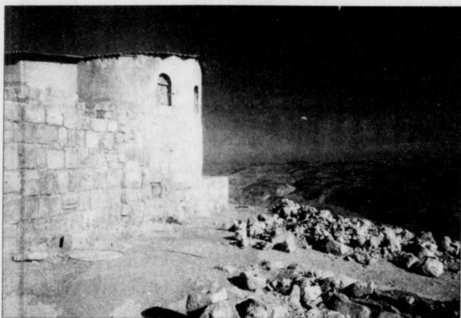
C'est du haut du mont Nébo que Moïse aurait contemplé la Terre promise.