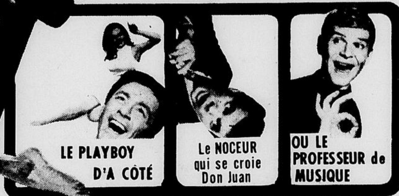
LE PLAYBOY D'A CÔTÉ

ELLE DOIT SE TROUVER UN MARI AU PLUS TOT... CHOISIRA-T-ELLE LE JEUNE et BEAU MILLIONNAIRE OU