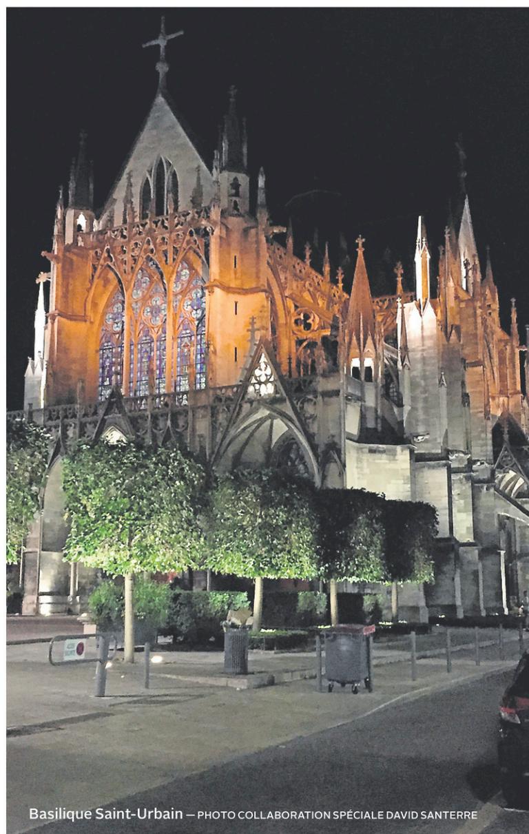
Basilique Saint-Urbain

On ne fait pas que bien boire en Champagne. La campagne autour de Troyes est le berceau de grands fromages des appellations Chaource et Soumaintrain, en plus des créations originales comme le Champ-sur-Barse ou le Délice-de-Mussy. Il est possible de visiter des producteurs. À Champ-sur-Barse, la Ferme de la Marque initie les visiteurs aux métiers de la ferme, du nettoyage de l'étable à l'élevage des veaux, le train et la dégustation de ses crèmes, yogourts, beurres fermiers comme on n'en trouve plus et, évidemment, une splendide tomme au lait cru. Succès familial assuré. Concept similaire à la Ferme des Tourelles, productrice des fromages fermiers Chaource et Soumaintrain, à Ervy-le-Châtel.