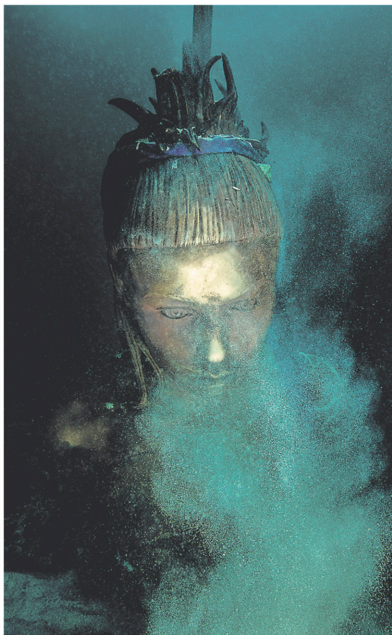
Treasures from the Wreck of the Unbelievable de Damien Hirst