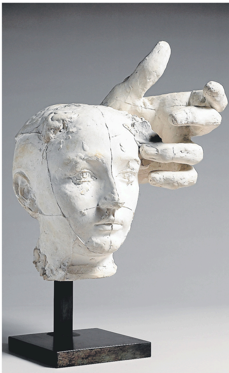
Masque de Camille Claudel et main gauche de Pierre de Wissant d'Auguste Rodin