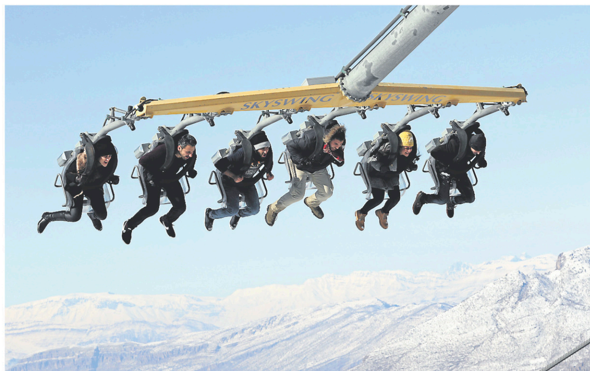
Quelques Kurdes profitant des installations de la station de ski de Korek.

Comme chaque année, Korek a ainsi organisé la semaine dernière un festival proposant une myriade d'activités : cours de ski, danse traditionnelle, courses de luge, tyrolienne... «Il est très important de développer le tourisme et le