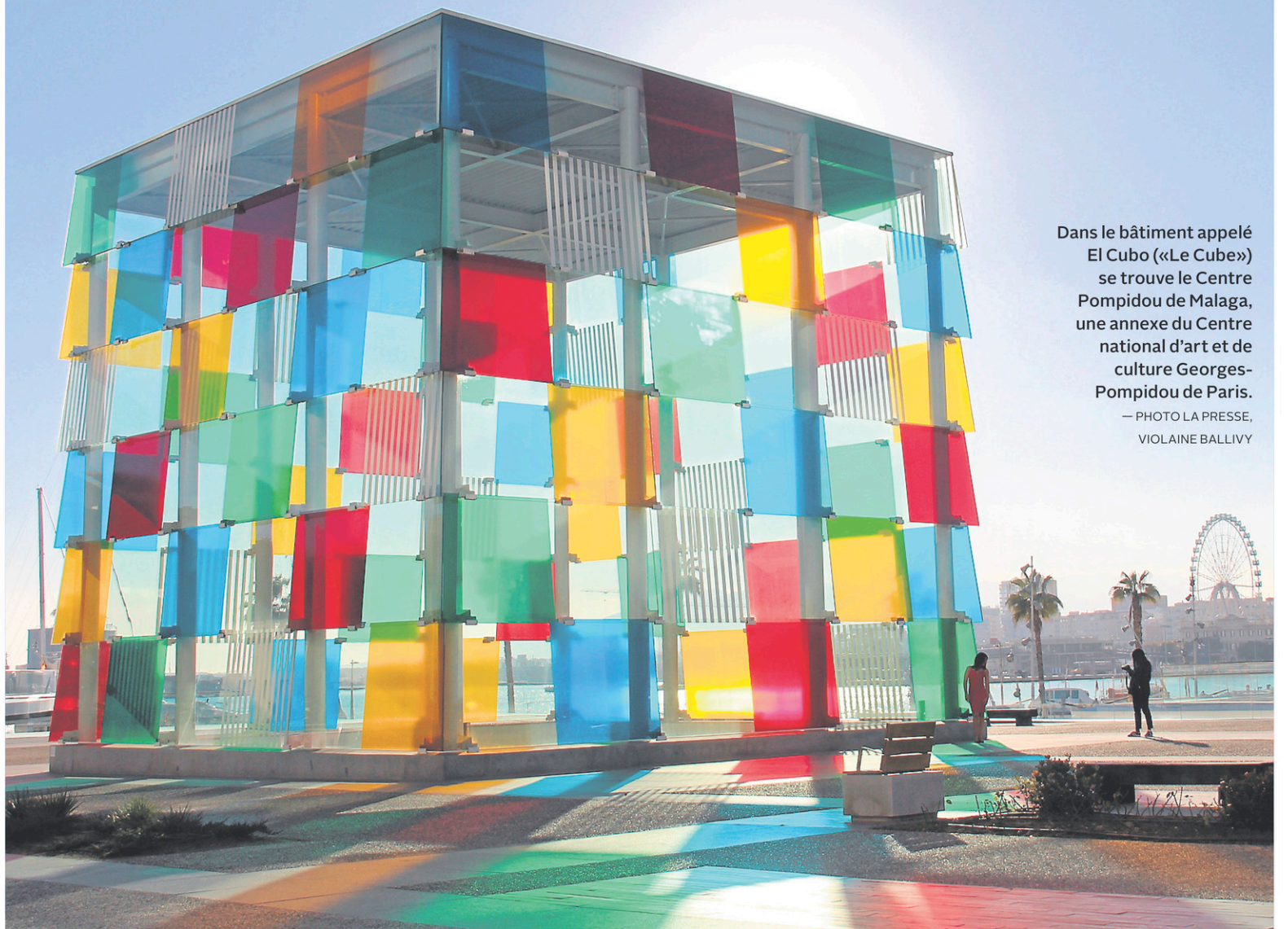
Dans le bâtiment appelé El Cubo («Le Cube») se trouve le Centre Pompidou de Malaga, une annexe du Centre national d'art et de culture Georges-Pompidou de Paris.

Malaga est une ville vibrante, vivante, surprenante. Comme l'a été son plus illustre enfant, Picasso, lequel disait : «Je ne cherche pas, je trouve.» Fondée il y a plus de 2800 ans, la ville a trouvé une identité qui a tout pour plaire. PAGES V6 ET V7