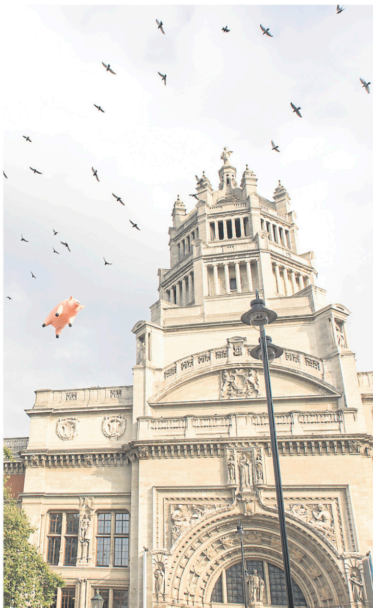
Le Victoria and Albert Museum de Londres accueillera l'exposition sur Pink Floyd.