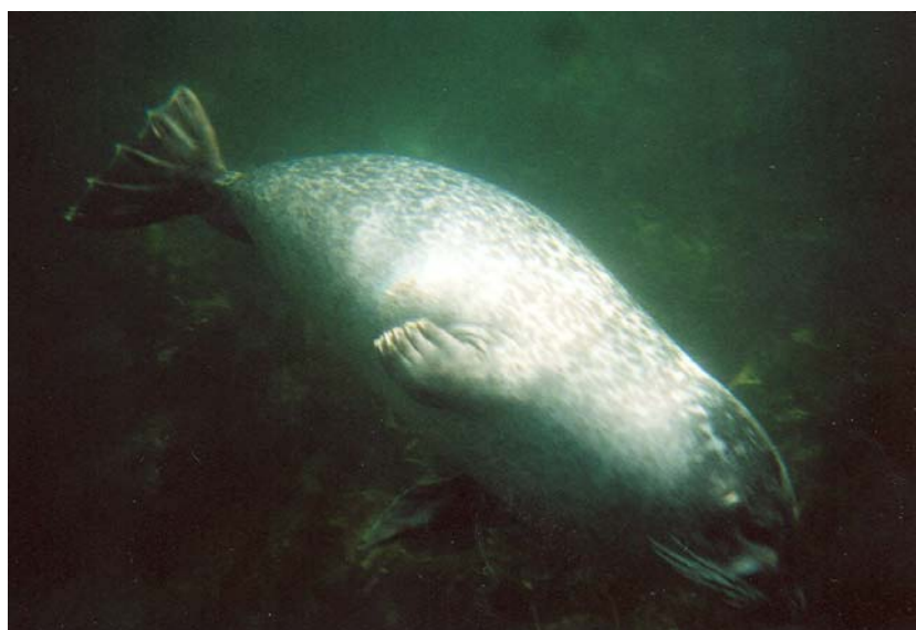
Phoque commun croqué sur le vif par Stéphanie Pieddesaux lors d'une plongée au cours du suivi AOM 2006