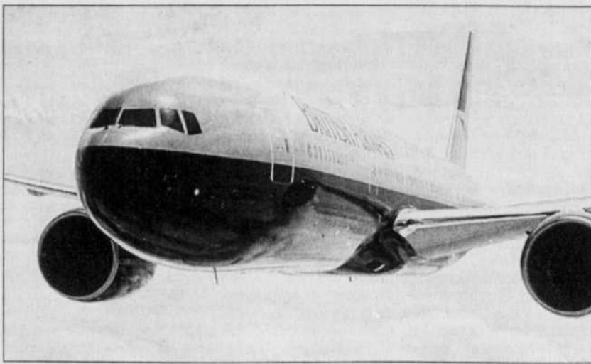
Boeing, à défaut de convaincre avec son propre «superjumbo», peut compter sur un 777 de plus en plus populaire.

Boeing a récemment annoncé la construction de versions à plus grand rayon d'action des 777-200 et 777-300. Le premier pourra ainsi emporter 301 passagers sur une distance de 16 404 kilomètres, soit 2092 km de plus que le modèle actuel. Le nouveau 777-300, d'une capacité de 365 places, disposera lui d'une autonomie de 13 330 km, soit 2253 km de plus.