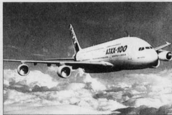
L'avenir du futur très gros porteur d'Airbus, l'A3XX, semble encore incertain.

Selon Airbus, les deux constructeurs font à peu près jeu égal depuis le début de l'année: en terme de parts de marché, Boeing mène d'une courte tête avec 52 % contre 48 % à Airbus, selon le consortium.