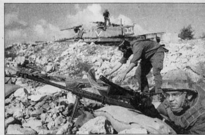
La poursuite des troubles israélo-palestiniens ajoute aux inquiétudes des courtiers.

Mettant ainsi l'accent sur les tensions qui s'exercent toujours sur le marché pétrolier, l'AIE, une éma-