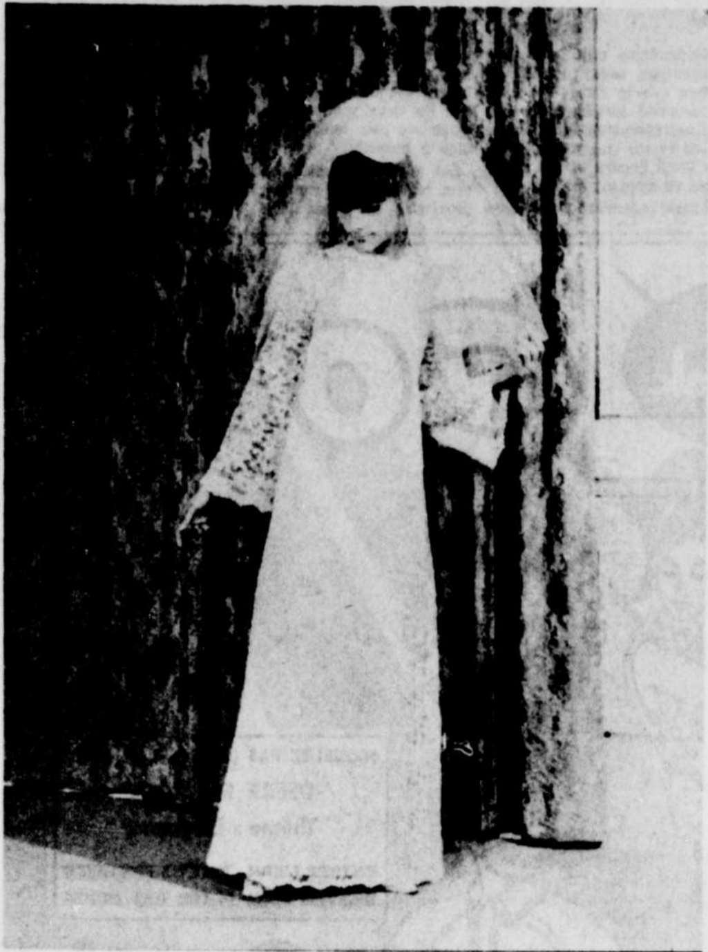
COMME une infante d'Espagne, cette très jeune mariée est toute vêtue de dentelle: une longue robe légèrement éva-