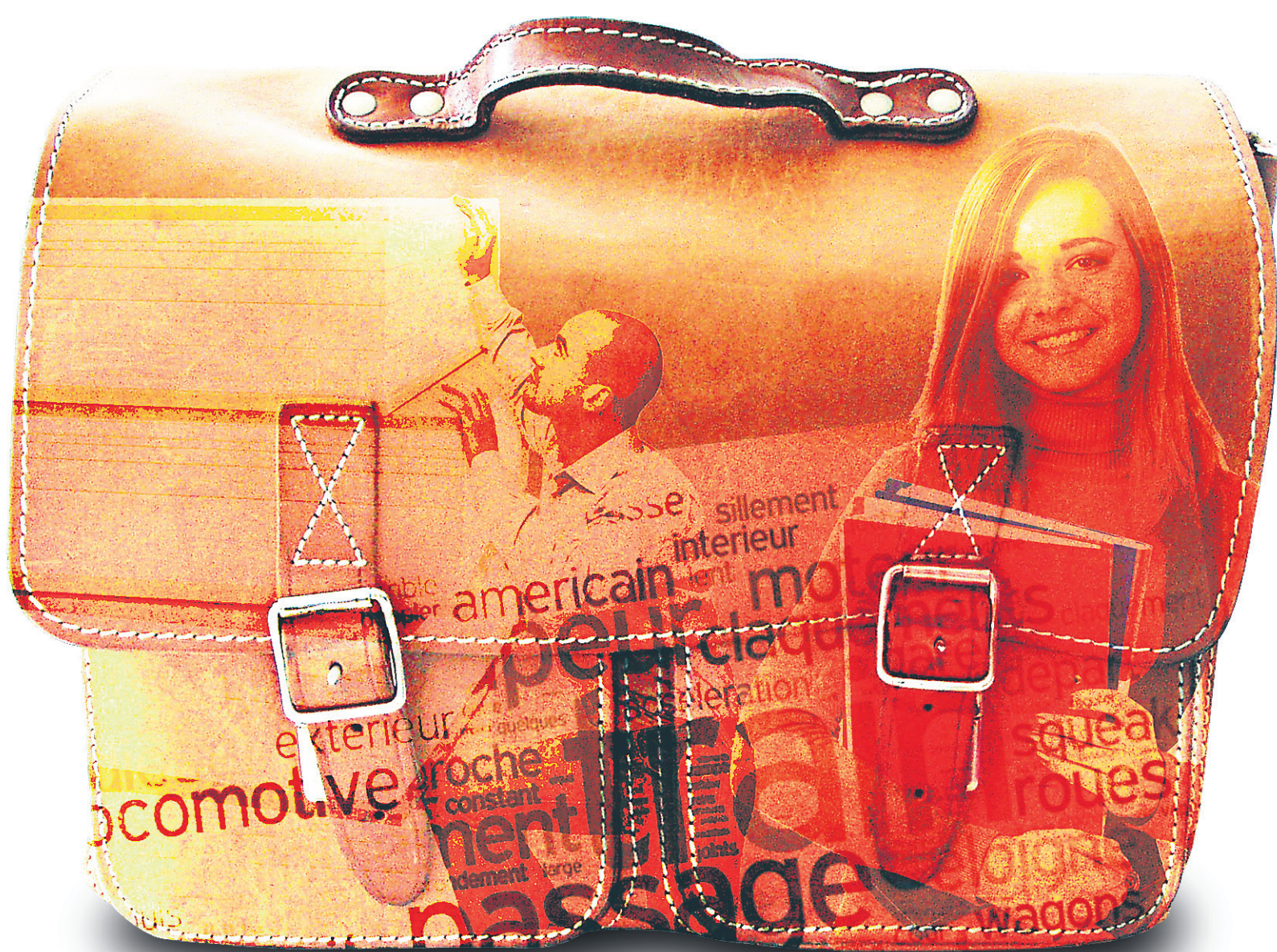
ILLUSTRATION DANIEL RIOPEL, LA PRESSE