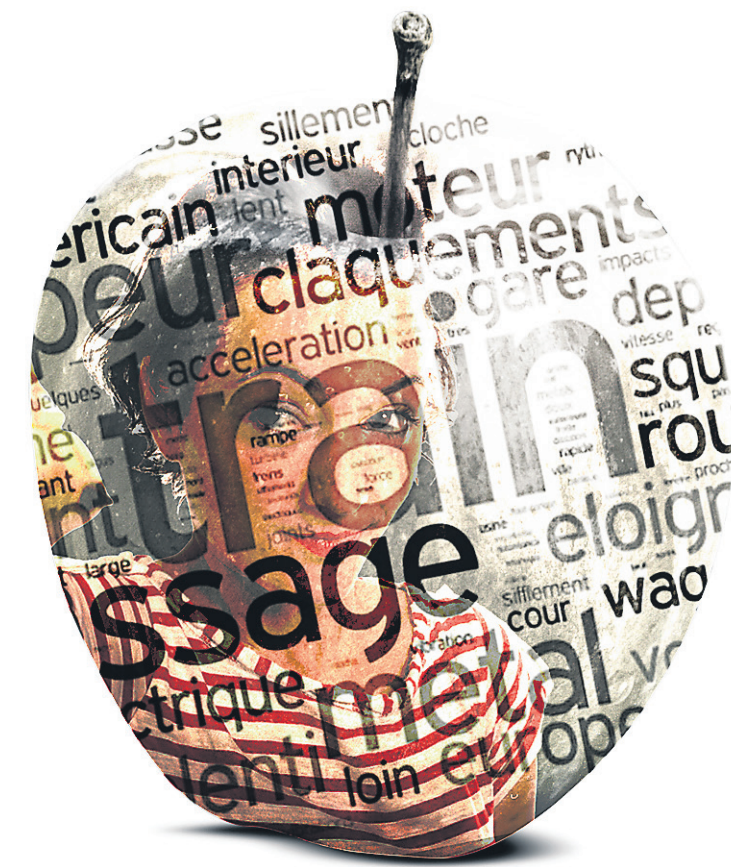
ILLUSTRATION DANIEL RIOPEL, LA PRESSE

Ce n'est pas tout d'attirer de nouveaux professeurs, il faut également les garder. « Les conditions de travail ne sont pas faciles pour les enseignants », d'après M me Bernard. Avec les réunions, les corrections et les rencontres de parents, les journées de travail sont longues. La précarité est aussi